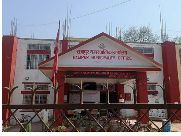
सन्तोष पौडेल/मध्यान्ह बर्दिया, २९ माघ

बिदाको घोषणा गरेको छ । बर्दियाको राजापुर नगरपालिकाले जनयुद्ध दिवस अर्थात् फागुन १ गते सार्वजनिक बिदाको घोषणा शारेको हो ।