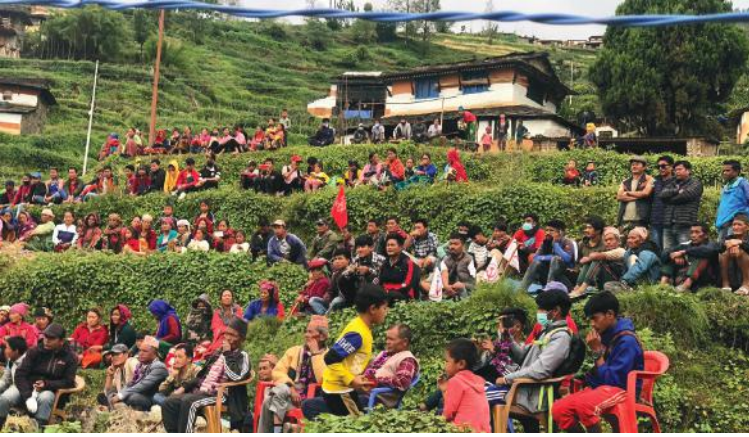
म्याग्दीको मालिका गाउँपालिका-५ देविस्थानमा नेकपा माओवादी केन्द्रले आयोजना गरेको चुनावी साभका सहभागी ।

मतदानको दिन नजिकै जाँदा सत्ता गठबन्धनका शीर्ष नेताहरूबाट चेतावनीको भाषा प्रयोग हुनु साभका उम्मेदवारलाई मोट आउँदैन कि भन्ने त्रासको उपज भएको जानकारीहरू बताउँछन् ।