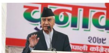
विरुद्धमा बोल्ने र पार्टी बाहिर गएर उम्मेदवारी दिनेहरूका लागि पार्टीमा कुनै

नेपाली कांग्रेसका सभापति एवं प्रधानमन्त्री शेरबहादुर देउवाले पुन गठबन्धनको विरोध गर्नेलाई कारवाही हुने बताएका छन् । शनिवार जनकपुरमा आयोजित ५ दलीय गठबन्धनद्वारा आयोजित सभालाई सम्बोधन गर्दै उनले गठबन्धनको