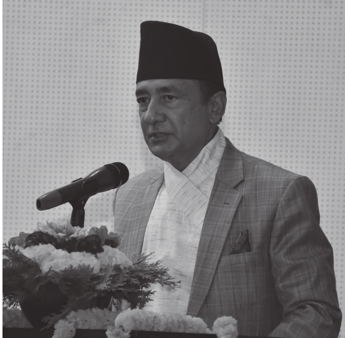
चाहना पूरा हुन सक्दैन, त्यसैले निभक्तताका साथ आफ्नो स्वतन्त्रतालाई मध्ये नजर गर्दै समाजलाई सुसूचित गर्नहोस्, सरकारलाई पहरेदारी गर्नुहोस्, सरकारलाई कानुनी शासनको सुशासनको बाटोमा हिँड्नका निमित्त