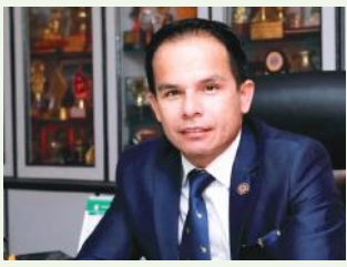
■ मृत थापा अध्यक्ष, नाडा अटोमोबाईल्लस एशोसिएशन अफ नेपाल

स्थानीय तहको निर्वाचनमा मत हाल्ने दिन नजिक आइसकेको छ । तपाईंले कसरी सहभागिता जनाइरहुनुभएको छ । हुन जाइरहेको स्थानीय तहको निर्वाचनमा आम मतदातालाई तपाईंको सुझाव के रहेको छ ?