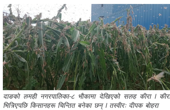
दाङको लमही नगरपालिका-८ भौकामा देखिएको सलह किरा। किरा भित्रिएपछि किसानहरू चिन्तित बनेका छन्।