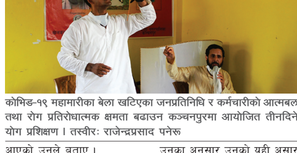
कोभिड-१९ महामारीका बेला खटिएका जनप्रतिनिधि र कर्मचारीको आत्मबल तथा रोग प्रतिरोधात्मक क्षमता बढाउन कञ्चनपुरमा आयोजित तीनदिने योग प्रशिक्षण।