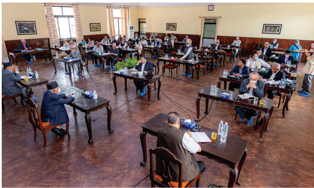
प्रधानमन्त्री निवास बालुवाटारमा बुधबार नेकपाको स्थायी कमिटीको बैठकमा प्रधानमन्त्री तथा अध्यक्ष केपी शर्मा ओली पार्टीका अध्यक्ष पुष्पकमल दाहाल प्रचण्ड लगायत।

सत्तारूढ नेपाल कम्युनिष्ट पार्टी (नेकपा) का अध्यक्ष एवम् प्रधानमन्त्री केपी शर्मा ओलीले स्थायी कमिटीका नेताहरूबाट बुधबार सुभाष लिएका छन्। बालुवाटार पुगेको स्थायी कमिटी नेताहरूले प्रधानमन्त्री ओलीलाई पार्टी निर्णय मानेर जाँदा अहिले देखिएको संकट हल हुने सुभाष दिएका छन्।