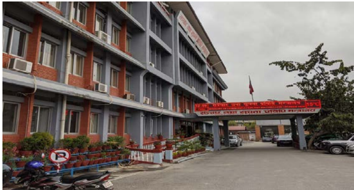
व्यवस्थापन तथा नियमन गरिने ऐनमा उल्लेख छ। सामाजिक सञ्जाल प्लेटफर्म मन्त्रालयले सामाजिक सञ्जाल नियमन गर्न चाहने व्यक्त, कम्पनी वा संस्थाले सामाजिक सञ्जाल व्यवस्थापन

काठमाडौं/मस- सञ्चार तथा सूचना प्रविधि मन्त्रालयले 'सामाजिक सञ्जाल (प्रयोग तथा नियमन) ऐन, २०८०' सम्बन्धी विधेयकमाथि सुभावा मागेको छ। सामाजिक सञ्जालको प्रयोगलाई मर्यादित, सुरक्षित र व्यवस्थित प्रयोग गर्न तथा सामाजिक सञ्जालको दुरुपयोगको कारण व्यक्त र समाजमा पर्सनको नकारात्मक प्रभावलाई निरुत्साहित गर्न ऐन ल्याउन लागेको मन्त्रालयले जनाएको छ।