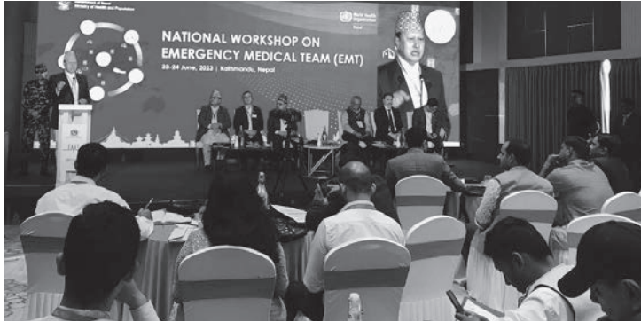
मध्याह्न संवाददाता काठमाडौं, ८ असार

स्वास्थ्य तथा जनसंख्या मन्त्री मोहनबहादुर बस्नेतले आपत्कालीन उपचार सेवा पदान गर्न तयारी अवस्थामा रहन देशभरिका चिकित्सक र स्वास्थ्यकर्मीलाई निर्देशन दिएका छन्। स्वास्थ्य तथा जनसंख्या मन्त्रालय र विश्वस्वास्थ्य संगठनको संयुक्त आयोजनामा शुरु भएको आपत्कालीन चिकित्सा टोलीको राष्ट्रिय कार्यशाला शुभारम्भ गर्दै उनले देशमा बाढीपहिरोको प्रकोपसँगै विभिन्न सरुवा रोगको सङ्क्रमण पनि बढ्ने खतरा