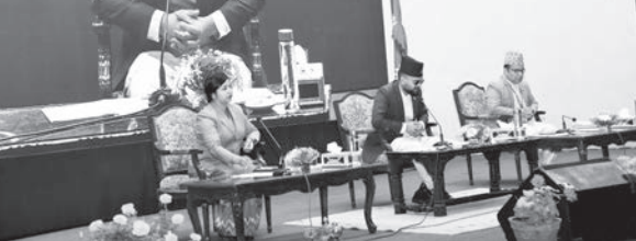
काठमाडौं/सस- काठमाडौं महानगरपालिकाको आगामी

आर्थिक वर्ष २०८०/८१ नीति तथा कार्यक्रम सर्वसम्मत पारित भएको छ। यही असार ६ गते नगर सभामा पेश भएको नीति तथा कार्यक्रम शुक्रवार बसेको १३औं अधिवेशनको दोस्रो बैठकले पारित गरेको हो।