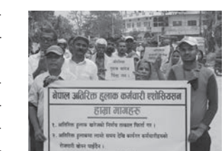
रोहट, ६ असार