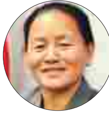
'पार्टीले म सभामुखमा किन अयोग्य भन्ने चिन्त बुझ्दो जवाफ दिए पछि मात्रै उपसभामुख पदबाट राजीनामा दिन्छु, त्यसै दिन ।'

सभामुख छनोटको विषयमा प्रधानमन्त्री केपी शर्मा ओलीसँग किचलो परिरहेका बेला नेकपा अध्यक्ष पुष्पकमल दाहाल प्रचण्डले केन्द्रीय राजनीतिमा जटिलता देखा परेको बताएका छन् । चितवनको माडीमा आयोजित खिचरा महोत्सवको उद्घाटन गर्दै उनले केन्द्रीय राजनीतिमा बेला-बेला केही जटिलता उत्पन्न हुने र अहिलेको अवस्था त्यस्तै भएको दावी गरे । पूर्व माओवादीका