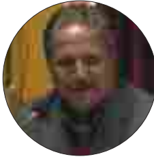
'तनाव त स्वतः हुने भयो । संसदका सबै कामहरू रोकिएका छन् । सत्तापक्षको कारणले संसद अवरूढ छ ।'