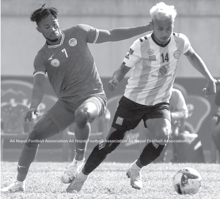
All Nepal Football Association All Nepal Football Association All Nepal Football Association