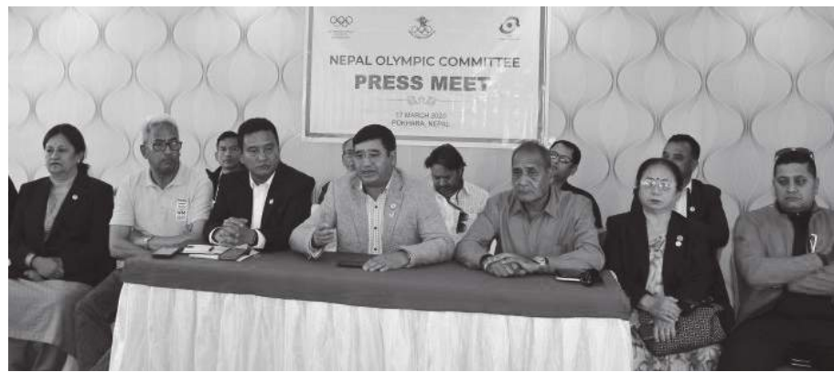
मध्यान्ह संवाददाता पोखरा, ४ चैत्र

नेपाल ओलम्पिक कमिटीले कार्यकारी निर्देशकमा चतुरानन्द राज वैद्यलाई नियुक्त गरेको छ । ओलम्पिकको विधानको च्याप्टर नौ को २७ दशमलव एका नहेर दैनिक कार्यलाई व्यवस्थित र सुचारु गर्नका लागि कार्यकारी निर्देशकमा नियुक्त गरेको हो ।