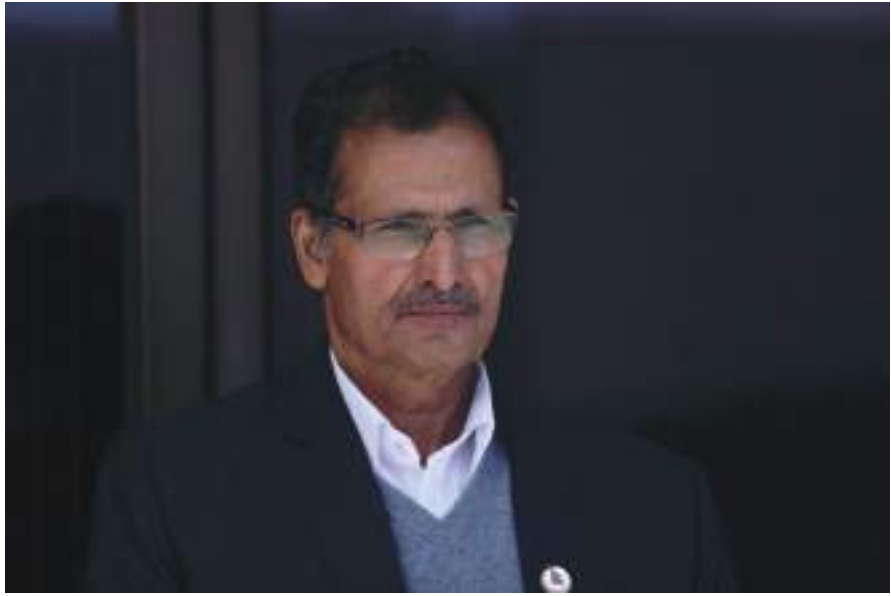
मध्यान्ह संवाददाता काठमाडौं, १० माघ