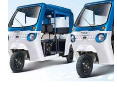
प्रालिने अग्नि गुपुका प्रतिनिधिहरूको उपस्थितिमा ३ नयाँ विक्री केन्द्रसहित १२ वटा महिन्द्राका शोरूमहरूमा 'नगद

काठमाडौं/मस - महिन्द्रा एण्ड महिन्द्रा (लास्ट माइल मोबिलिटी) को ट्रियो इलेक्ट्रिक अटो र यारी माघ २२ (आइतवार) ३ नयाँ विक्री केन्द्रबाट सार्वजनिक गरिएको छ । महिन्द्रा एण्ड महिन्द्रा (लास्ट माइल मोबिलिटी) ले ट्रियो नामक लिथियम-आइओन सञ्चालित इलेक्ट्रिक श्री-ह्विलर दमक, भैरहवा र नेपालगञ्जबाट सार्वजनिक गरिएको हो । अग्नि गुपुअन्तर्गतको सहायक कम्पनी एवम् महिन्द्रा एण्ड महिन्द्रा (लास्ट माइल मोबिलिटी)का आधिकारिक विक्रेता अग्नि इनर्जी