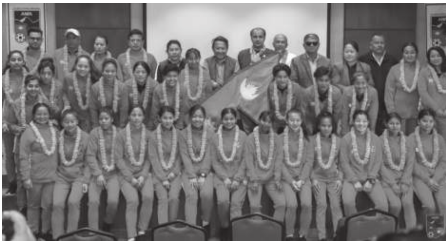
मार्च १७ मा बंगलादेशको सामना गर्नेछ। यस्तै मार्च २१ मा फेरि भारतसँग खेल्ने मार्च २३ मा बंगलादेशसँग खेल्ने तालिका रहेको छ। शीर्ष टोलीले उपाधि जित्नेछ।

सन् २०१८ मा भूटानमा भएको पहिलो प्रतियोगिताको सेमिफाइनलमा भारतलाई हराएको नेपाली टिम बंगलादेशसंग पराजित भएपछि उपाधिबाट बञ्चित भएको थियो। तेस्रो संस्करणको प्रतियोगिताका लागि आयोजक भारत सहित नेपाल र बंगलादेशले भारतको जमशेदपुरमा मार्च १५ देखि २५ तारिखसम्म प्रतिस्पर्धा गर्ने छन्। च्याम्पियनसिपका लागि टोली शनिवार भारत प्रस्थान गर्नेछ।