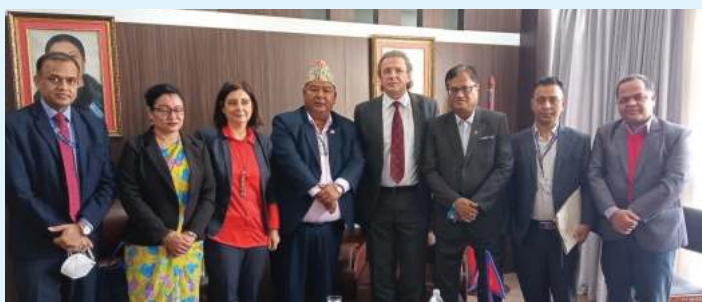
वैदेशिक रोजगार विशेष