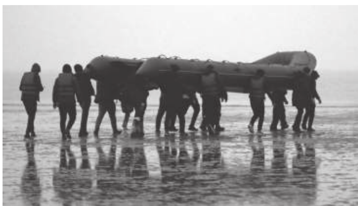
अधिकारीहरूले हवाई तथा जल मार्गबाट उद्धारको काम गरेका थिए। बेलायती

काठमाडौं/एजेन्सी- बेलायत जाँदै गरेका आप्रवासी सवार च्यानलमा डुंगा डुब्दा २७ जनाको ज्यान गएको छ। फ्रान्सेली कालेड नजिकै रहेको बेलायती च्यानल (पानीको ठूलो बहावयुक्त नहर) मा डुंगा डुबेको हो। फ्रान्सेली अधिकारीले बुधवार २७ जना डुबेको बताएका थिए, तर पछि उनीहरूले मृत्यु हुनेको संख्या २७ रहेको उल्लेख गरेका हुन्। मृत्यु हुनेमा पाँच महिला र एक बच्चा रहेको फ्रान्सेली आन्तरिक मामिला मन्त्रालयले जनाएको विधिबिहीन उल्लेख गरेको छ। फ्रान्सेली तथा बेलायती