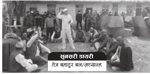
सुनसरी डायरी वेज बहादुर बज/मध्याह्न

विषयमा गुटबन्दी हुने पार्टीकैलागि घातक भएको गुनासो पोखेका थिए। सहमति या निर्वाचन प्रक्रियाबाट ने तत्त्व चयन भइसकनुपर्नेमा अहिलेसम्म विवादमै अल्झनुले पार्टीको शिर फुकेको उनले दुबैसो पोखे।