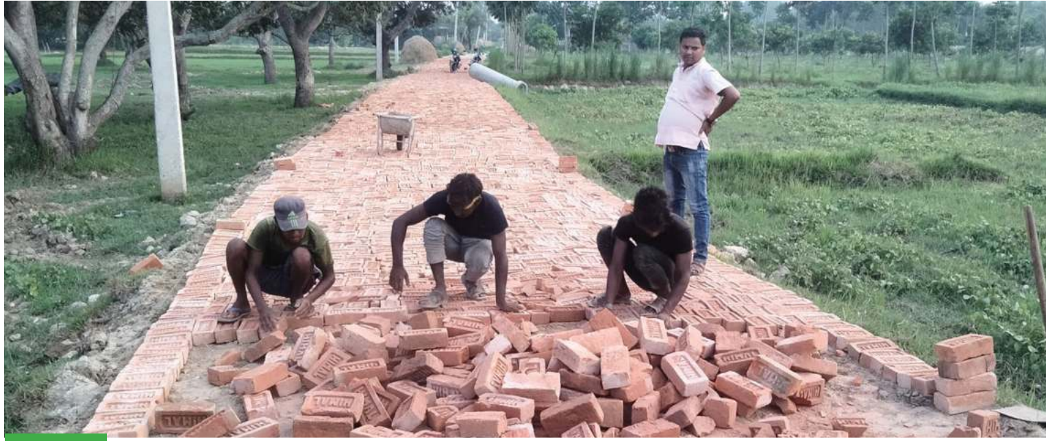
सडक निर्माण माहेतरी जिल्लाको सदरमुकाम जलेश्वर बजारमा गाउँमा सडक निर्माणको क्रममा ईटा ओखुयाउँदै मजदुर ।