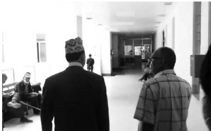
स्वास्थ्य तथा जनसंख्या मन्त्रालयका मन्त्री मोहनबहादुर बस्नेतसहितको टोलीले काठमाडौं उपत्यकाभित्र रहेका विभिन्न आठ अस्पतालमा विहीवार अनुगमन गरेको छ।

काठमाडौं/मस- स्वास्थ्य तथा जनसंख्या मन्त्रालयले काठमाडौं उपत्यकाभित्र रहेका विभिन्न आठ अस्पतालमा विहीवार अनुगमन गरेको छ। मन्त्रालयले अनुगमन टोली बनाएर विहीवार महाराजगञ्जस्थित कान्ति बाल अस्पताल, स्वयम्भूस्थित मनमोहन मेमोरियल अस्पताल, भक्तपुर अस्पताल (भक्तपुर), नागरिक कम्प्युनिटी अस्पताल (भक्तपुर), मॉडर्निस्टी अस्पताल (भैरहवा), अल्का अस्पताल (जाबलाखेल), नेपाल मेडिकल कलेज (जोरपाटी) र शंकरापुर अस्पताल (जोरपाटी)मा अनुगमन गरेको हो। स्वास्थ्यमन्त्री मोहनबहादुर बस्नेतसहितको टोलीले विहीवार स्वयम्भूस्थित मनमोहन मेमोरियल अस्पतालमा अनुगमन गरेको थियो। सोही अवसरमा मन्त्री बस्नेतले त्यहाँस्थित पोस्ट अपरेटिभ वाईर्ड, शल्यचिकित्सा वाईर्ड, रक्तसञ्चार युनिट, मेडिकल वाईर्ड, नाक, कान, घाँटी वाईर्ड, मनोचिकित्सा वाईर्ड र प्रशासन विभागलागायत सबै ठाउँमा अनुगमन गरेका थिए। सो अवसरमा मन्त्री बस्नेतले