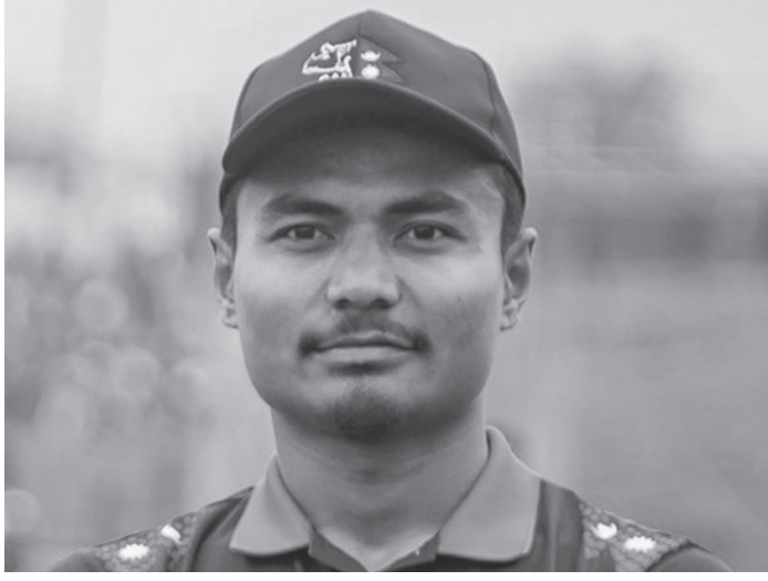
पछिल्लो अनुभवले आगामी एसिया कपमा धेरै मद्दत पुग्ने उनको विश्वास छ। रोहितले टिमले यस पटक धेरै कुरा सिक्ने आएको बताए। आफूहरूले विशेषत ब्याटिङमा र्दत बलहरूमा काम गरेको उनको भनाइ थियो। यस्तै कप्तान रोहितले कुनै पनि खेलाडी

काठमाडौं/मस- एसीसी इमर्जिड टिमस एसिया कप खेलेर नेपाली राष्ट्रिय क्रिकेट टिम नेपाल फर्किएको छ। इमर्जिड कपका साथै एसिया कपका लागि दुई साता तयारी गरेर नेपाली राष्ट्रिय क्रिकेट टिम श्रीलंकाबाट विहीवार स्वदेश फर्किएको हो। टिमलाई त्रिभुवन अन्तर्राष्ट्रिय विमानस्थलमा नेपाल क्रिकेट संघ (क्यान)का पदाधिकारीले स्वागत गरेका थिए। इमर्जिड टिमस एसिया कपमा नेपाली टोलीले समूह चरणमा खेलेका तीनमध्ये दुई खेल हारेको थियो। यस्तै नेपालले एसिया कपको तयारीका लागि श्रीलंकाका चार टिमसँग अभ्यास खेल खेलेको थियो।