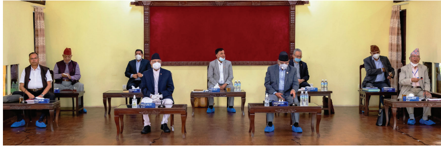
नेपाल कम्युनिष्ट पार्टी (नेकपा) को स्थायी कमिटी शनिबार बालुवाटारमा बसेको बैठकमा अध्यक्षद्वय केपी शर्मा ओली र पुष्पकमल दाहाल 'प्रचण्ड' लगायत ।

शुक्रबार स्थायी कमिटी बैठकमा अनुपस्थित रहेपछि प्रधानमन्त्री केपी शर्मा ओलीको सत्तारूढ नेपाल कम्युनिष्ट पार्टी (नेकपा) का स्थायी कमिटीका नेताहरूले कडा आपत्ति जनाएका छन् । शनिबार भने प्रधानमन्त्री केपी शर्मा ओली केहीबेर बसेका थिए ।