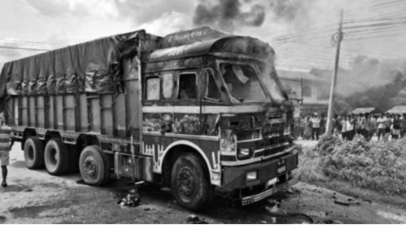
सागर संगम ठाकुर/मध्याह्न रौतहट, ७ भदौ

रौतहटमा ट्रकको ठक्करबाट एकजना महिलाको घटनास्थलमै मृत्यु भएको छ। पूर्व-पश्चिम राजमार्ग अन्तर्गत जिल्लाको चन्द्रपुर नगरपालिका-१ हाईवेस्थित नुनथर मन्दिर जाने बाटोमा ट्रकले ठक्कर दिँदा एक महिलाको मृत्यु भएको हो।