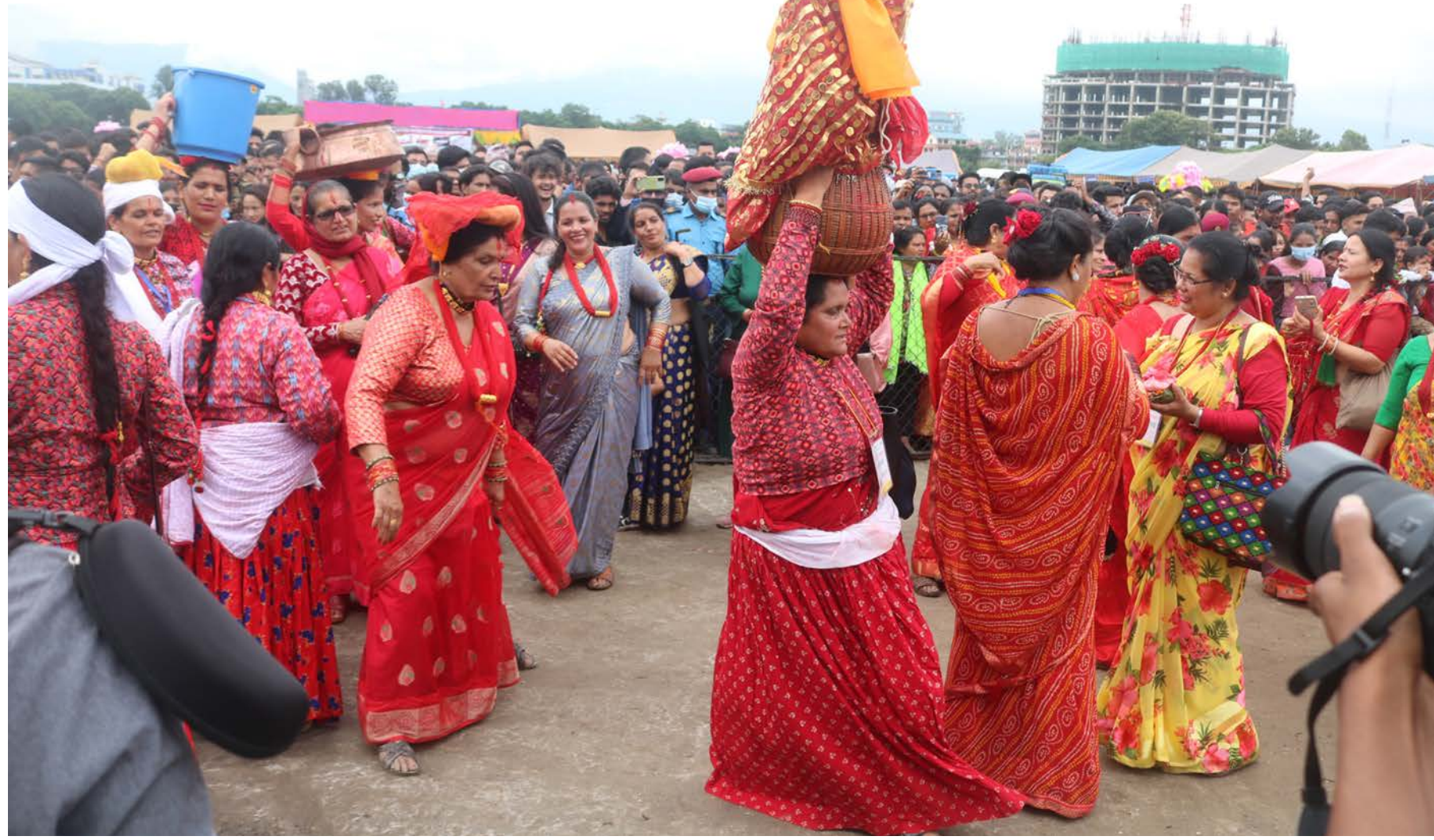
काठमाडौंको टुडिसलेमा बिहीबार आयोजना गरिएको गौरा पर्वमा गौरादेविलाई शिरमा राखेर जाच्दै महिला ।