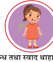
गन्ध तथा स्वाद थाहा नहुने

यस्ता लक्षणहरू देखा परेमा नजिकको तोकिएको स्वास्थ्य केन्द्रमा सम्पर्क गर्नुहोस्।