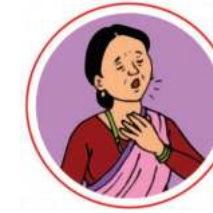
श्वास फेर्न गाह्रो हुने