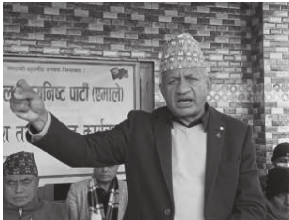
प्रदिप जवाली, मध्याह्न वृत्तव, २३ माघ

ने कपा (एमाले)का उपमहासचिव तथा पूर्वपरराष्ट्रमन्त्री प्रदीपकुमार जवालीले मिलेनियम च्यालेन्ज कर्पोरेसन (एमसीसी) सम्झौताबारे सार्वभौम संसदमा छलफल हुनुपर्ने बताएका छन् । प्रेस चौतारी रुपन्देहीले वृत्तवामा आइतबार आयोजना गरेको पत्रकार भेटघाटमा उपमहासचिव जवालीले एमसीसी सम्झौताबारे जनतालाई यथाधिक जानकारी दिन पनि संसदमा पेश गरेर छलफल हुनुपर्ने बताए । उपमहासचिव जवालीले एमसीसीको विषयलाई सभामुखले संसदमा आउने होका बन्द गर्न नहुने भन्ने यसलाई अनुमोदन गर्ने वा नगर्ने भन्ने विषय सार्वभौम संसदमा छलफल हुनुपर्ने बताए । उनले सदरमा एमसीसीले प्रवेश पारपाछि मात्र एमालेले आफ्नो धारणा सार्वजनिक गर्ने स्पष्ट पारे । नेता जवालीले एमसीसी सम्झौताका विषयमा सरकार र सत्ता गठबन्धनका केही नेताले मिजोले काम गरिरहेको उल्लेख गर्दै पाँच महिनासम्म समय मागेर अहिले अन्याय सिर्जना गर्नु अन्तर्राष्ट्रिय जगतमा नेपालको विश्वसनीयतासमेत संकटमा पार्ने काम भएको बताए । उनले भने, 'अमेरिकातर्फ फर्केर एउटा कुरा र नेपालतर्फ फर्केर अर्को कुरा गर्ने दोहोरो चरित्र देखियो ।'