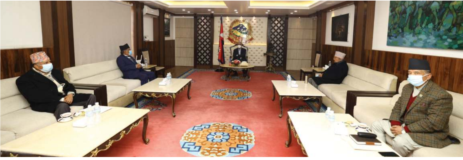
प्रधानमन्त्री शेरबहादुर देउवा, नेकपा एमालेका अध्यक्ष केपी शर्मा ओली, नेकपा माओवादी केन्द्रका अध्यक्ष पुष्पकमल दाहाल "प्रचण्ड" प्रधानमन्त्री निवास बालुवाटारको बैठकमा ।

प्रधानमन्त्री देउवा एमसीसी जसरी पनि पास गर्नुपर्ने अडानमा रहेपछि सत्ता गठबन्धनमा आवद्ध दलबीच मतभेद बढ्ने संकेत देखिएको छ ।