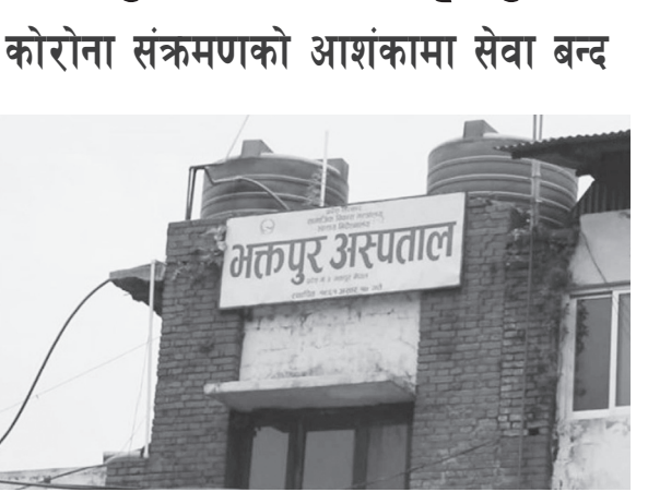
भक्तपुर/मस- भक्तपुर अस्पतालमा एक सुत्केरीको मृत्यु भएपछि अस्पतालको सबै सेवा बन्द भएको छ। सुत्केरी व्यथा लागेपछि आइतबार साँफे अस्पताल आएका सिन्धुपाल्चोक लिसड्डु गाउँपालिका-३ घर भई हाल चाँगुनारायण नगरपालिका-३ भौखेल बस्ने ३६ वर्षीया महिलाको राति मृत्यु भएको हो।