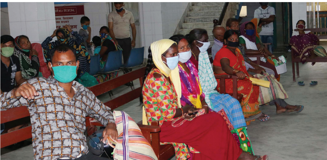
कोशी अस्पताल विराटनगरको बहिरङ्ग सेवामा सोमबार स्वास्थ्य परीक्षण गर्न आएका सर्वसाधारण ।

कोभिड-१९ को संक्रमण पुष्टि भएको भोलिपल्टै नै पोखरामा एक संक्रमितको मृत्यु भएको छ । आइसोलेसनमा उपचारत ६० वर्षीय वृद्ध पुरुषको मृत्यु भएको स्वास्थ्य तथा जनसंख्या मन्त्रालयले जनाएको छ । स्याङ्जाको वालिङ नगरपालिकाका ती संक्रमित वृद्धको मृत्यु भएको प्रदेश सरकारले जनाएको छ । संक्रमित पुरुषको पोखरा स्वास्थ्य विज्ञान प्रतिष्ठानमा गएको जेठ २२ गते देखि उपचार भइरहेको थियो । मन्त्रालयले ती संक्रमित दीर्घ रोगी रहेको