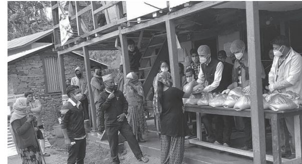
सन्तोष पौडेल/मध्यान्ह खोटाङ, २५ जेठ

विश्वव्यापी रुपमा फैलिएको कोरोना भाइरस संक्रमणको जोखिमका कारण हाल देशभर लकडाउन जारी छ। यसै बेला खोटाङको दिक्तेल रुपाकोट मझुवागढी नगरपालिकाका केही युवाहरुले युवा जागरण, कोरोना नियन्त्रण अभियान भन्ने मूल नार सहित जनचेतनामूलक सन्देश फैलाउँदै नगरपालिका भित्रका तीन वटा वडाहरुमा ४ लाख बराबरको राहत सामग्री वितरण गरेका छन्। युवा जागरण कोरिना नियन्त्रण