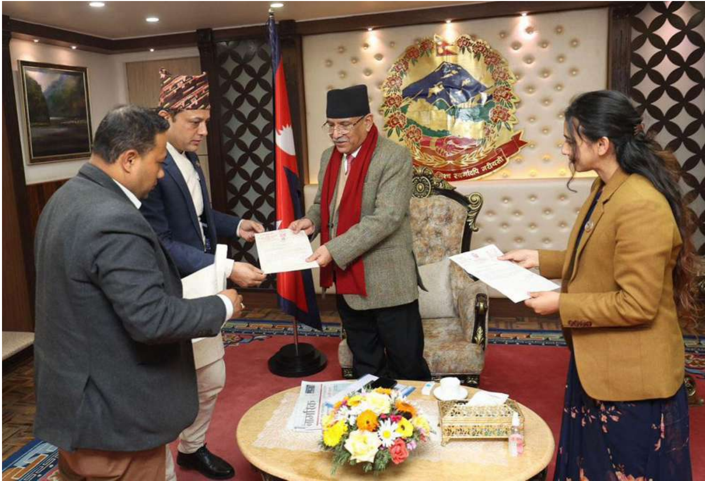
प्रधानमन्त्री पुष्पकमल दाहाल 'प्रचण्ड'लाई राजीनामा पत्र बुझाउँदै राष्ट्रिय स्वतन्त्र पार्टीका तीन मन्त्री ।