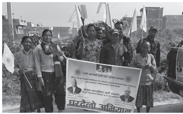
वृद्धि, दाङका महिला विकासमा पहिला भन्ने नारा सार्थक बनाउन महिला हिंसा शून्य सहनशीलता अपनाउने पनि संकल्पपत्रमा उल्लेख गरिएको छ।

पर्यावरण, भूउपयोग नीति तयार पार्ने भूउपयोगको आधार कृषि र आवासको सुधार, उद्यमशीलता, श्रम र रोजगार जनताको अधिकार स्थापित गर्न स्वरोजगारी सिर्जना गरी सामाजिक सुरक्षाको प्रत्याभूति दिलाउने संकल्पपत्रमा उल्लेख छ। युवा खेलकूदको विकास गर्दै युवालाई विदेश पलायन हुनबाट रोक्न खेलकूद प्रवाधान समयमै सम्पन्न गर्ने, युवा स्वरोजगार र सूचना केन्द्र स्थापना गरिने, ज्येष्ठ नागरिकको सम्मानका लागि सामाजिक सुरक्षा भत्तामा