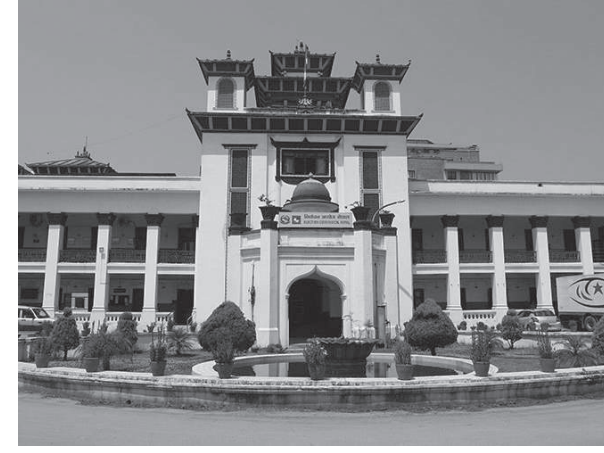
अनुमतिपत्रको सकल प्रमाणका आधारमा अन्तिम मतदाता

काठमाडौं/मस- निर्वाचन आयोगले मङ्सिर ४ गते हुने प्रतिनिधिसभा तथा प्रदेशसभा सदस्य निर्वाचनका लागि अन्तिम मतदाता नामावलीमा नाम समावेश भएका मतदाताले आयोगबाट जारी मतदाता परिचयपत्रका साथै परिचय खुल्ने अन्य आधिकारिक कागजातका आधारमा मतदान गर्न पाउने निर्णय गरेको छ । आयोगले परिचयपत्रका साथै नेपाली नागरिकताको प्रमाणपत्र वा राष्ट्रिय परिचयपत्र वा राहदानी वा जग्गाधनी प्रमाणपत्र वा सवारीचालक