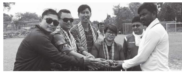
प्याटोटिक क्रिकेट एकेडेमी सेन्टर, सेन्टर र विराटनगर क्रिकेट क्लब मिलेर क्रिकेट एकेडेमी ट्रेनिङ ट्रेनिङ एकेडेमीमा विभाजन गरी