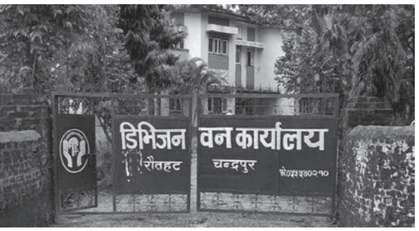
सत्येन्द्र प्रताप सिंह/मध्यान्ह रौतहट, २४ साउन

राष्ट्रिय वनबाट काठका गोर्लिया तस्करीको घटना बढ्दै गएपछि डिभिजन वन कार्यालय रौतहट चन्द्रपुरले गस्ती तीव्र पारेको छ। काठ तस्करी गर्ने तस्करी समूह बुन्दावन, बनबहुअरी, जुडिबेला, बागमती र गैँडाटारमा सक्रिय भएपछि वन गस्ती बढाइएको डिभिजन वन कार्यालयले बताएको छ। केही दिन अघि मात्र वन कार्यालयको गस्ती टोलीले चार थान काठको गोर्लियासहित एक पिकअप भ्यान बोलेरोलाई नियन्त्रणमा