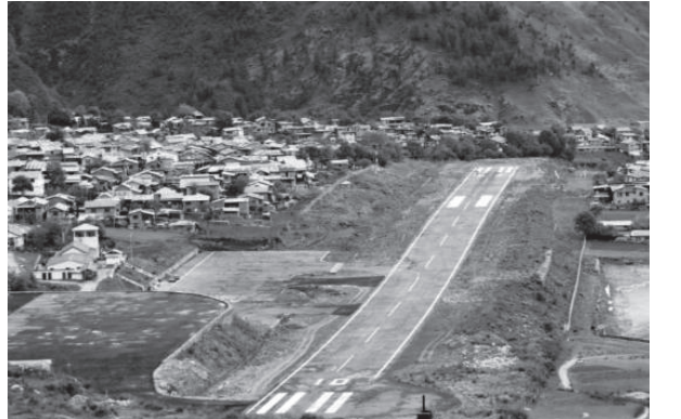
ओबराज शाही/मध्यान्ह हुम्ला, २४ साउन

नागरिक उड्डयन प्राधिकरणले आन्तरिक उडानमा नयाँ नियम लागू गरेपछि हुम्लासहित कर्णालीका हिमाली जिल्लाको उडान ठप्प भएको छ। प्राधिकरणले साउन दोस्रो सातादेखि विमानस्थलको उडान तालिकाअनुसार उडान भर्नुपर्ने नियम लागू गरेसँगै दैनिक उडान ठप्प भएको हो। खराब मौसमका कारण हुम्लामा चार दिनदेखि हवाई सेवा अवरुद्ध छ। सिमकोट विमानस्थलमा बर्खाको समयमा विहान १२ बजेसम्म मौसममा सुधार नहुने र उडान तालिकाअनुसार साढे १२ बजेपछि उडान भर्न नपाइने भएकाले हुम्लाको हवाई सेवा ठप्प भएको हो। प्राधिकरणको नयाँ नियम लागू भएसँगै हुम्लावासी समस्यामा परेका छन्। हवाई सुरक्षाका लागि नयाँ नियम राम्रो भए पनि हिमाली जिल्लाका लागि