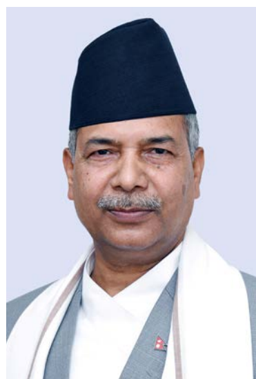
अस्मिता बम / मध्यान्ह काठमाडौं, २४ साउन ।

परराष्ट्रमन्त्री एनपी साउदका अनुसार प्रधानमन्त्री प्रचण्डले आगामी सेप्टेम्बर तेस्रो साता (असोजको शुरुवात) उत्तरी छिमेकी चीनको भ्रमण गर्ने छन् । वर्तमान सरकार गठनपछि प्रधानमन्त्री प्रचण्डले भारत भ्रमण गरेका छन् ।