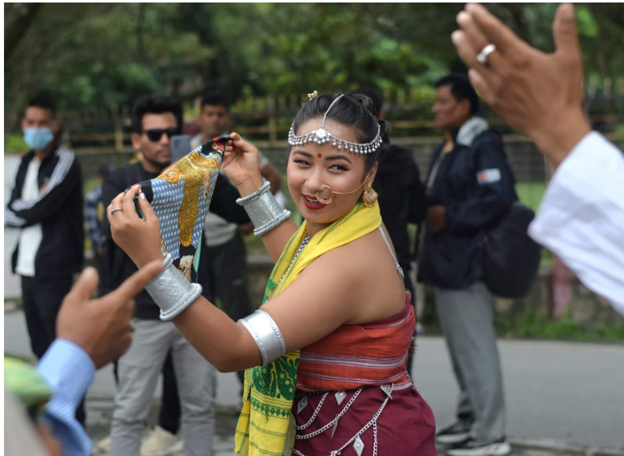
२९औं विश्व आदिवासी जनजाति दिवसको अवसरमा बुधवार मौलिक शैक्षिकी युवती ।

परराष्ट्रमन्त्री एनपी साउदका अनुसार प्रधानमन्त्री प्रचण्डले आगामी सेप्टेम्बर तेस्रो साता (असोजको शुरुवात) उत्तरी छिमेकी चीनको भ्रमण गर्ने छन् । वर्तमान सरकार गठनपछि प्रधानमन्त्री प्रचण्डको भारत भ्रमण गरेका छन् ।