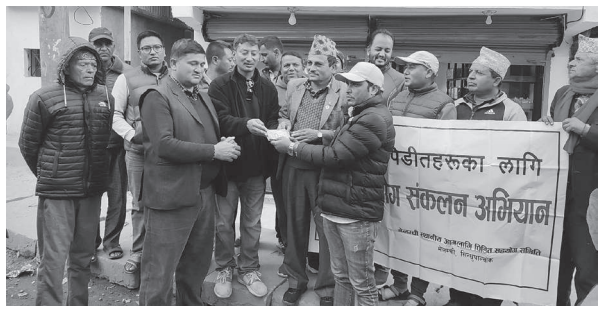
देवराज सुवेदी/मध्याह्न सिन्धुपाल्चोक, १८ मंसिर

गत कात्तिक ७ गते मेलम्ची ११ मा भएको आगलागी पिडितहरूका नाममा संकलित रकम पदान गरिएको छ। मेलम्ची वजारका व्यवसायी तथा सस्थाहरूबाट संकलन गरिएको ४ लाख ३२ हजार ९५ रुपैयाँ आइतबार प्रदान गरिएको हो। आगलागीबाट ४ वटा पसल, होटल, बेकरी तथा घरमा गरी करोडौं रुपैयाँको क्षति भएको थियो।