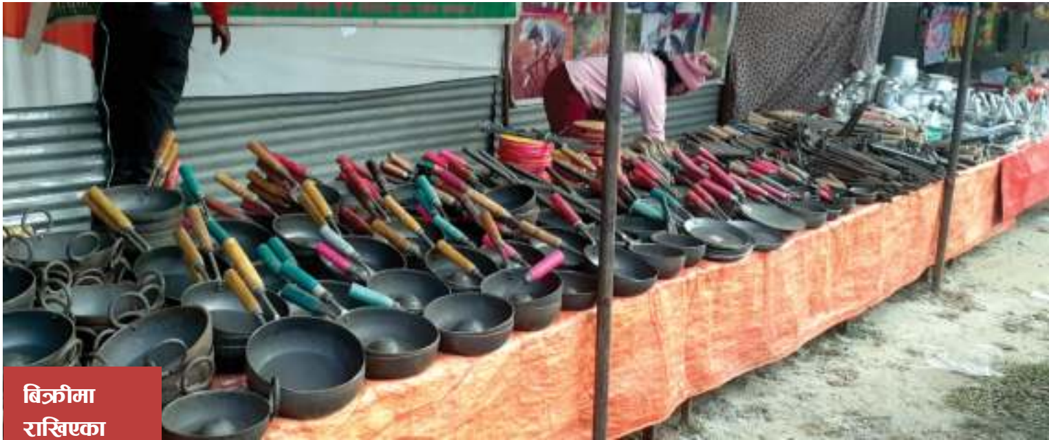
बित्रीमा राखिएका कृषि औजार

ट्यास नगरपालिका-५ बेनीपाटनमा आयोजित प्रथम दलौली पाटन सांस्कृतिक तथा पर्यटन महोत्सवको स्टलमा बित्रीका लागि राखिएका कृषि औजार ।