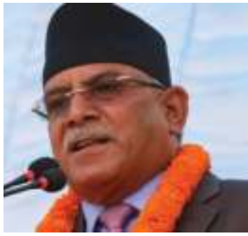
'पहिला-पहिला पुँजीको उद्योगमा, उत्पादनमा लगानी हुन्थ्यो, त्यहाँबाट आउने नाफा पुँजीपतिहरूले लिन्थे, आजभोलि पुँजीको लगानी पुँजीमै हुन्छ' हुँदै, मूर्खतया पुँजीको लगानी पुँजीमै हुन्छ'

अहिलेको पुँजीबजारले साम्राज्यवादको विकसित रूप र वित्तीय एकाधिकार