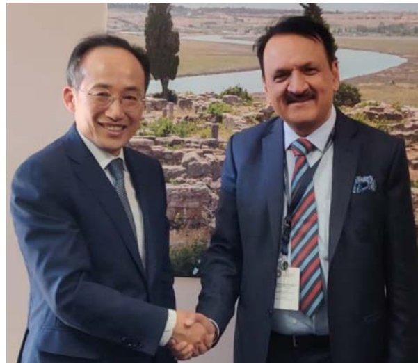
कृष्णानन्द भट्ट/मध्यान्ह मॉरिङको, २५ असोज ।

अर्थमन्त्री डा. प्रकाश शरण महतले नेपालमा बहुराष्ट्रिय कम्पनीहरूले नाफा कमाइरहेकोले कोरियाली बहुराष्ट्रिय कम्पनीहरूलाई पनि लगानी गर्न आग्रह गरेको बताएका छन् । कोरियाका उपप्रधानमन्त्री तथा अर्थमन्त्री कु च्युङसंगको भेटमा अर्थमन्त्री महतले नेपालमा बहुराष्ट्रिय कम्पनीले मुनाफा आर्जन गरिरहेकोले कोरियाली बहुराष्ट्रिय कम्पनीहरूको लगानी नेपालमा पनि भित्र्याउनुपर्ने बताए । नेपालमा लगानी