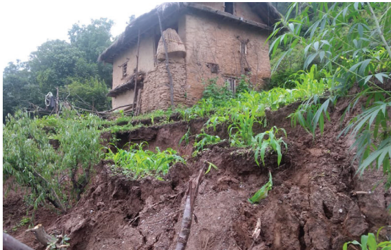
बारेकोट गाउँपालिका-५ पाखागा गत बिहीबार गएको पहिरोले जोखिममा घर। जोखिम बढ्न थालेपछि घर छाडेर सर्वसाधारण सुरक्षित क्षेत्रमा गएका छन्।