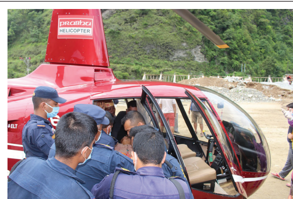
म्याग्दीको धवलागिरि गाउँपालिका-६ मराङमा गत शुक्रबार गएको पहिरोमा परेका घाइतेलाई उपचारका लागि हेलिकप्टरमार्फत पोखरा पठाइँदै।