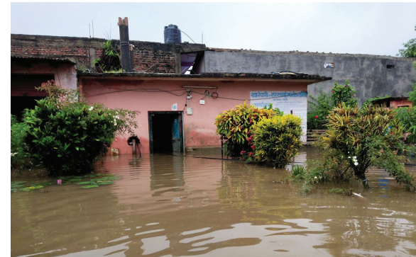
तीन दिनदेखिको वर्षाका कारण ढल्केवर खानेपानी आयोजनाको कार्यालय डुबानमा परेपछि खानेपानी वितरण कार्य प्रभावित भएको छ।