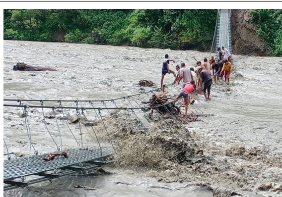
वर्षाका कारण बाजुराको बूढीगंगा नदीमा पानीको सतह बढेपछि बूढीगंगा र त्रिवेणी नगरपालिका जोड्ने ताम्रीसेरामा रहेको भोक्रुङ्गे पुलमा जोखिमपूर्ण यात्रा गर्दै स्थानीयवासी।

पहिरोबाट सिन्धुपाल्चोक, म्याग्दी, पर्वत, गुल्मी, बर्भाङ, लमजुङ, कास्की, रुकुम, जाजरकोट, रोल्पा लगायतमा जनघनको क्षति। सिन्धुपाल्चोकको बाह्रबिसे लगायत देशभरका विभिन्न जिल्लामा बाढी र पहिरोमा परी बेपत्ता भएकाहरुको खोजीमा कठिनाइ भएको छ। बुधबार साँफको पहिरोले बेपत्ता भएका सिन्धुपाल्चोकका २० बेपत्ता अर्भक फेला पर्न सकेका छन्।