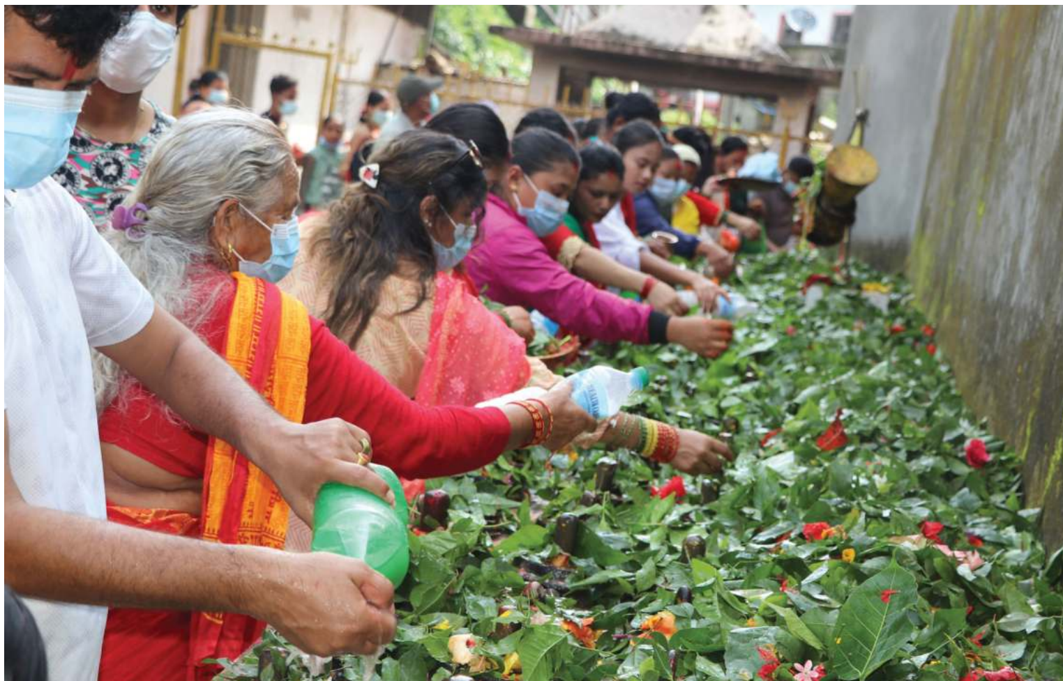
पवित्र तीर्थस्थल देवघाटधाममा स्थानपश्चात् नारायणी नदीकिनारमा रहेको शिवलिङ्गमा बेलपत्र चढाउँदै तीर्थालु ।