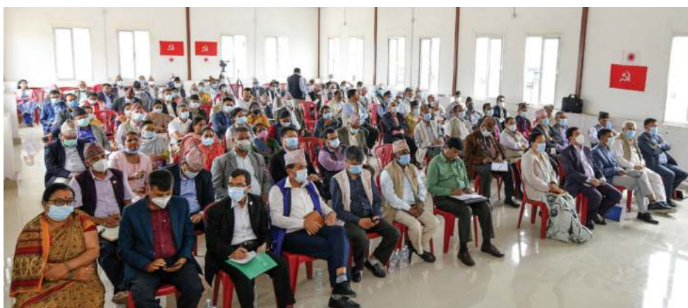
ललितपुरको तुलसीलाल स्मृति प्रतिष्ठानमा सोमबार बसेको नेपाल कम्युनिष्ट पार्टी एमालेको दशौं केन्द्रीय कमिटी बैठक ।

प्रधानमन्त्री शेरबहादुर देउवालाई विश्वासको मत दिने २२ सांसदलाई २४ घण्टे स्पष्टिकरण सोध्ने नेकपा एमालेले निर्णय गरेको छ । बरिष्ठ नेता माधवकुमार नेपाल सहित २२ सांसदले प्रधानमन्त्री देउवालाई विश्वासको मत दिएका थिए ।