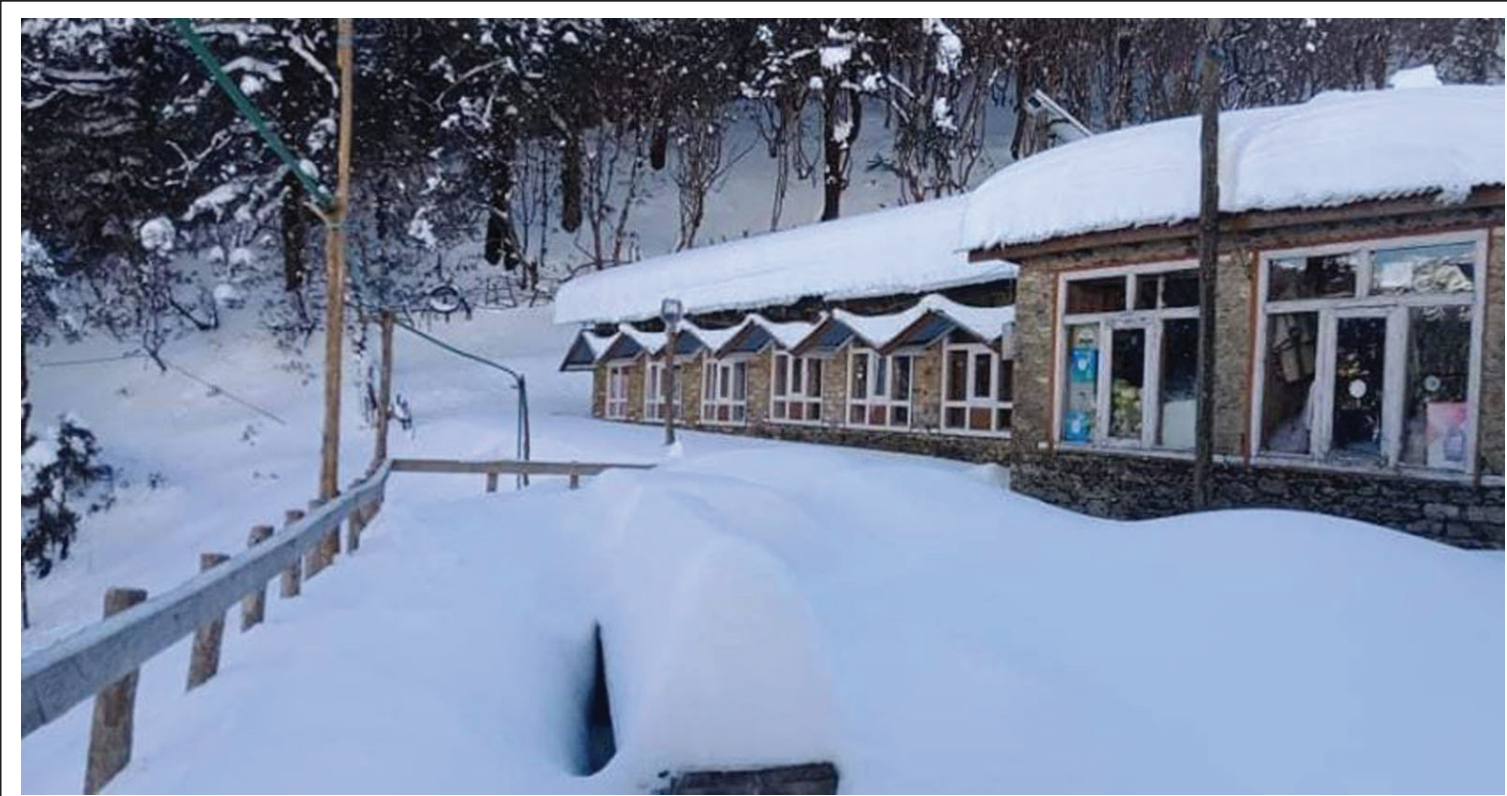
सिन्धुपाल्चोकको हेलम्बु र पाँचपोखरीमा मङ्गलबार भएको भारी हिमपात। हिमपातपछि जनजीवनमा प्रभाव परेको छ।