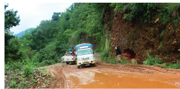
बागलुङ बजारदेखि घोडा बाँधे खण्डको काठेखोला गाउँपालिका-१ स्थित खहरेखोला नजिकै हिलोमा मुग्धै गरेको सवारी साधन।

काठमाडौं/रासस- यातायात व्यवसायी र मजदूरले सो क्षेत्रमा देखिएको समस्या तत्काल समाधान गरिदिन आग्रह गरेका छन्। यातायात क्षेत्रको विद्यमान समस्या समाधान गर्नका लागि निर्माण गरिएको कार्यदललेसंसदको प्रमुख प्रतिपक्षी दल नेपाली कांग्रेसका सभापति शेरबहादुर देउवालालाई भेटेर यातायात क्षेत्रको विद्यमान समस्या समाधानका लागि भूमिका निर्वाह गरिदिन आग्रह गरेका हुन्।