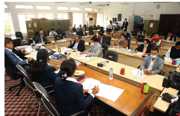
संघीय संसद प्रतिनिधिसभा, सार्वजनिक लेखा समितिको मंगलबार सिंहदरबारमा बसेको बैठक।

विश्वव्यापी कोभिड महामारीका कारण मुलुक त्रसित छन्। गएको चैत ११ गते देखि लकडाउन जारी गरिएकोले नेपालको अर्थतन्त्र चौपट बनेका छन्। साना उद्योगहरू बन्द प्राय छन् भने यसको मार ज्यालादारी मजदुरी गर्ने वर्गमा धेरै परेको छ। कोभिड महामारीका कारण अर्थतन्त्रमा आएको संकटले नेपालका ठूला मिडिया हाउसहरूले धमाधम कर्मचारी कटौती गरिरहेका छन्। वर्षौ पत्रकारिता गरेकाहरू अहिले बेरोजगार बनेका छन्। अर्को तर्फ नेपालमा महामारीको संख्या पनि बढिरहेको छ। बुधवार मात्रै नेपालमा ११६ जनामा संक्रमण पुष्ट भएको छ। देशभरका २५ प्रयोगशालामा गरिएको पीसीआर परीक्षणबाट ११६ जनामा संक्रमण पुष्ट भएको छ। स्वास्थ्य तथा जनसंख्या मन्त्रालयका अनुसार, बुधवार थपिएको सँगै नेपालमा संक्रमित संख्या १७ हजार १७७ जना पुगेको छ। गएको २४ घण्टामा ६९७ जना निको भएर घर फर्किएका छन्। यो सँगै नेपालमा निको भएर घर फर्कनेको संख्या एघार हजार २५ पुगेको छ। अर्थात्, संक्रमित मध्ये ६४ प्रतिशत संक्रमित निको भएका छन्।