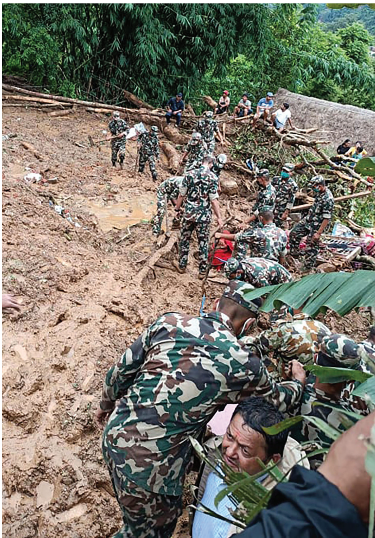
तनहुँको व्यास नगरपालिका-५ चापाघाटस्थित कालीभञ्जन गण (इ) बाट खटिएका नेपाली सेना व्यास नगरपालिका-९ माफफौंटमा सोमबार पहिरोमा पुरिएर बेपत्ता भएकाको खोजी गर्दै।