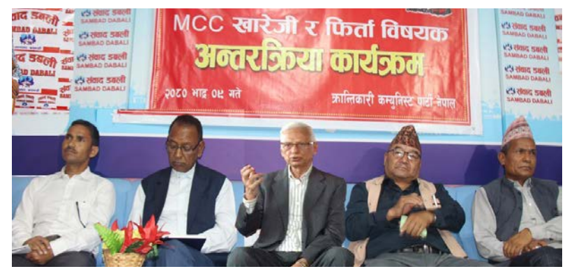
शनिवार काठमाडौंस्थित संवाद डबलीमा क्रांतिकारी कम्युनिष्ट पार्टी नेपालले आयोजना गरेको 'एमसीसी खारेज वा फिर्ता' कार्यक्रममा सहभागिहरू ।

एमसीसी नेपाल कम्प्याक्ट अन्तर्गत कार्यान्वयन हुने विद्युत प्रसारणलाइन र सडक निर्माणसम्बन्धी आयोजनाको काम इआइएफ मिति घोषणा भएको पाँच वर्षभित्रमा सम्पन्न गरिसक्नुपर्नेछ । यसरी पाँच वर्ष गणना थालिने अवधि यही भदौ १३ गतेलाई तोकिएको हो ।