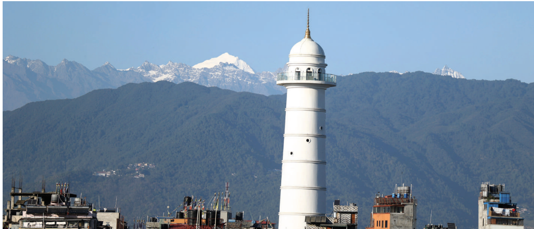
सुलेको आकाश: मौसम खुलेसँगै काठमाडौंबाट देखिएको मनोरम हिमशृङ्खला र राजधानी उपत्यकाको धरहरा।