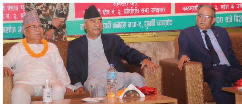
काठमाडौं -&gt; रिश्त काँडाघारीमा सत्तागठबन्धनका दलहरूले आइतबार संयुक्त कार्यक्रममा सहभागी शीर्ष नेताहरू।

त्यस्तै, आयोगले घरदैलोमा जाँदा बाजागाजा, भोजभतेर र अनावश्यक होहल्ला गर्न नपाइने जनाएको छ। उम्मेदवारहरूबाट आचारसंहिता उल्लंघनका दर्जनौं उजुरी परेको भन्दै त्यस्ता उजुरीमाथि सुक्ष्म अध्ययन गरिरहेको र दोषी पाइएमा कारवाहीको दायरामा ल्याएरै छाड्ने आयोगको दाबी छ। तर, सत्तागठबन्धनले कार्तिक