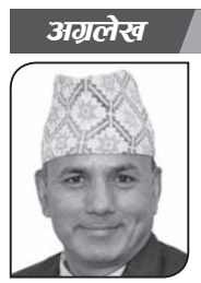
● नेत्र सुवेदी प्रयास