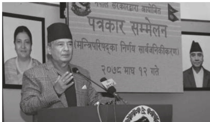
प्रदान गरेको छ।

बैठकले भोजपुरस्थित नेपाली सेनाको फस्ट राइफल गणको ब्यारेक परिसरको उत्तर र पूर्वतर्फ फैलिएको स्थानीयको स्वामित्वमा रहेको करिब २० रोपनी १५ आना दुई दाम जग्गा प्राप्त गर्न स्वीकृति