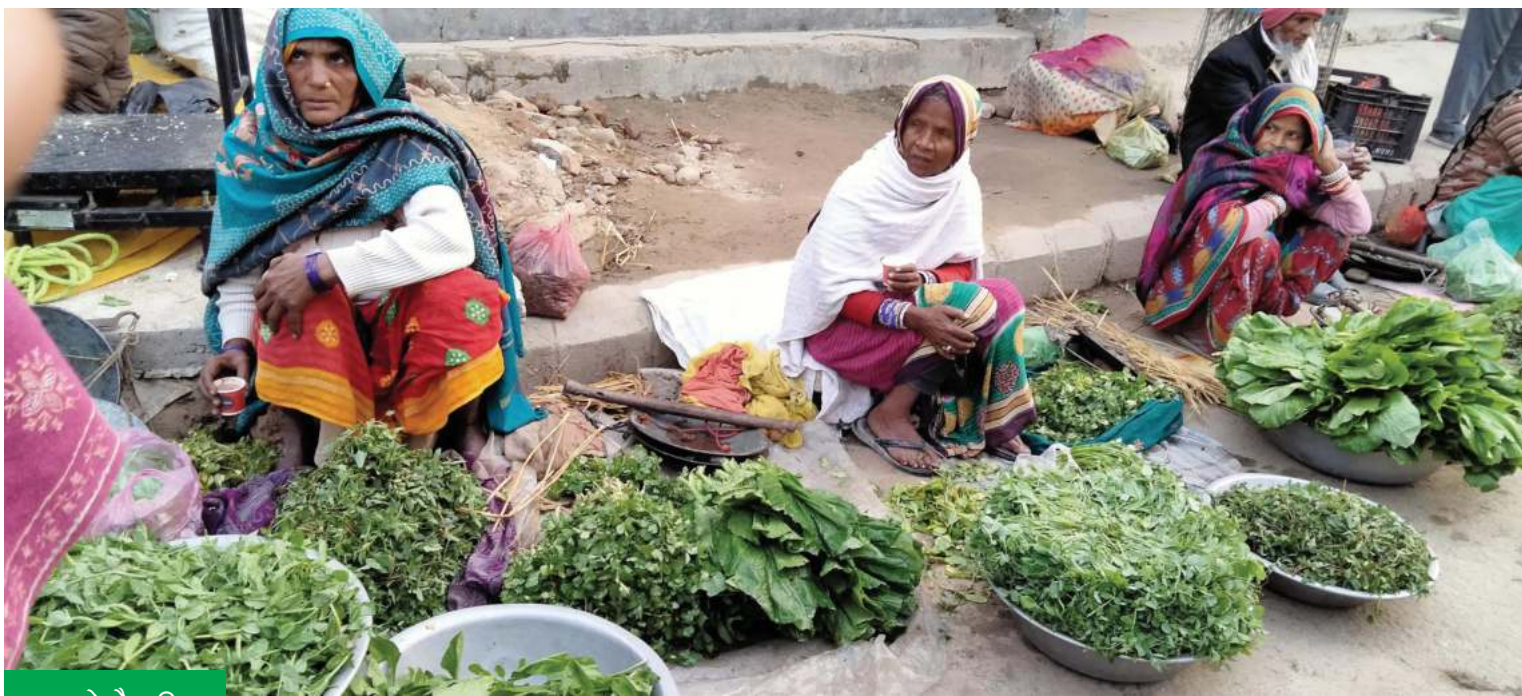
सागा बेच्दै महिला

महोत्सवीको सदरमुकाम जलेरवरको जीजा बजारमा सागा बेच्दै महिला व्यापारी ।