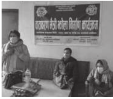
पनि घोराही चेम्बरले आफ्नो सामाजिक उत्तरदायित्वको काम गर्दै महिलाहरूलाई

घोराही चेम्बर अफ कमर्सको व्यवस्थापनमा १० दिने वातावरण मैत्री भोला निर्माण कार्यक्रम शुरु गरिएको छ। घोराही उपमहानगरपालिकाको आर्थिक सहयोगमा कार्यक्रम सञ्चालन गर्न थालिएको हो।