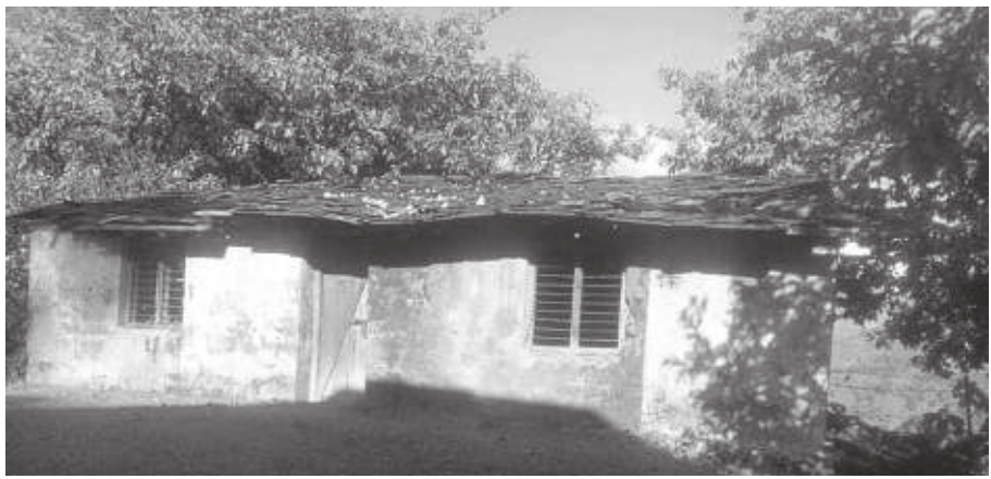
दिपक बाबु साउद/मध्याह्न दाचला, १ साउन

उत्तमले पैसा नउठ्ने डरले पीडितहरू भने मुद्दा दर्ता गर्न डराउने गरेको पनि जानकारी दिए । मानव बेचबिखन तथा ओसारपसार (नियन्त्रण) ऐन २०६४ अनुसार किन्ने वा बेच्ने उद्देश्यले मानिसलाई विदेशमा लगेमा तथा प्रचलित कानूनबमोजिमवाहेक मानिसको अङ्ग फिकेमा मानव बेचबिखन गरेको मानिने उल्लेख छ । कुनै प्रकारको फाइदा लिई वा नलिई वेश्यावृत्तिमा लगाउनेलाई दशदेखि १५ वर्षसम्म कैद र रु ५० हजारदेखि एक लाखसम्म जरिवाना हुने कानूनी व्यवस्था छ ।