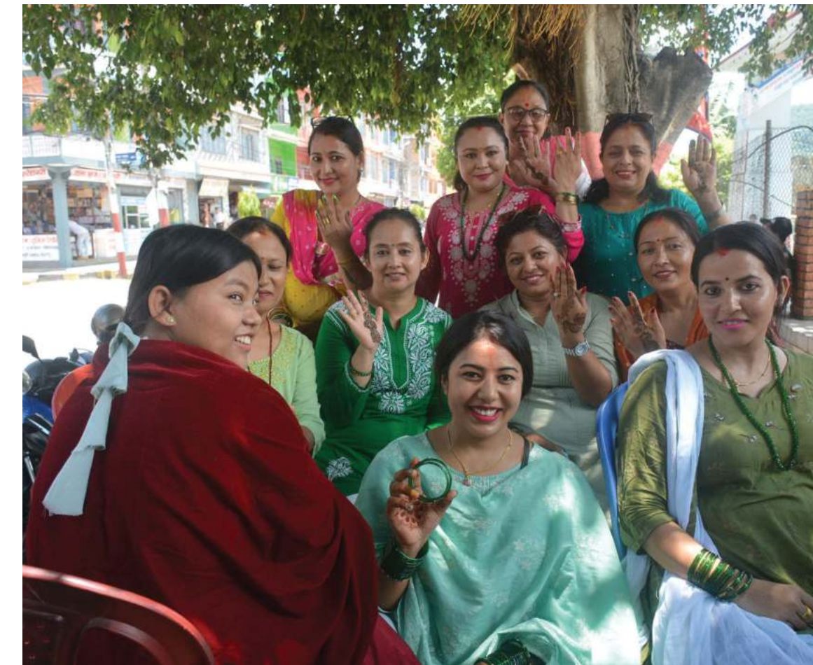
लियो क्लब अफ तनहुँ सत्यवतीले आइतबार दमौलीमा गरेको मेहेन्दी कार्यक्रममा सहभागी महिलाहरू । साउन महिनामा मेहेन्दी र हरियो घुरा लगाउने प्रचलन छ ।

अहिले कार्यान्वयनमा आएको फि भिसा फि टिकट व्यवहारिकरूपमा कतिसम्म लागू भएको छ भन्ने कुरा प्रश्नको घेरामै छ भन्दै महानिर्देशक