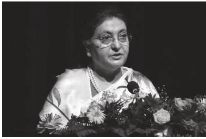
शिक्षाको प्रवर्द्धन गर्न अतिआवश्यक रहेको पनि बताइन्। संविधानले स्वास्थ्य सेवामा सबैको पहुँच पुर्याउने कुरालाई मौलिक हकको रूपमै व्यवस्था गरेको

काठमाडौं/मस- राष्ट्रपति विद्यादेवी भण्डारीले जनतालाई पायक पर्ने स्थानमै स्वास्थ्य सेवा उपलब्ध गराउन सम्बन्धित सबै पक्षले ध्यान केन्द्रित गर्नुपर्ने बताएकी छन्। आइतबार काठमाडौंमा आयोजित त्रिवि चिकित्सा शास्त्र अध्ययन संस्थानको स्वर्ण जयन्ति समारोहलाई सम्बोधन गर्दै उनले रोगहरूको उपचार गर्न ठूला शहर, राजधानी र विदेश धाउनुपर्ने परिस्थितिको अन्त्य गरी जनतालाई सहज हुने स्थानमा स्वास्थ्य सेवाको आवश्यक व्यवस्था मिलाउन सम्बन्धित सबै पक्ष लाग्नुपर्ने बताएकी हुन्। राष्ट्रपति भण्डारीले मेडिकल शिक्षा र स्वास्थ्य सेवालाई जनताको आकांक्षा अनुसार व्यवस्था गर्न स्वदेशमा मेडिकल