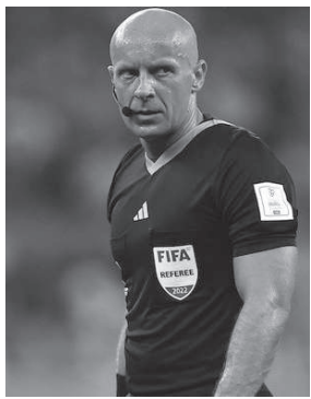
नागरिक पनि बन्ने छन्। मार्सिनीकले डेनमार्क र फ्रान्सबीचको समूह चरणको

काठमाडौँ/एजेन्सी- कतार विश्वकप फुटबलको फाइनल खेल पोल्यान्डका रेफ्रीले खेलाउने भएका छन्। विश्व फुटबलको सर्वोच्च निकाय फिफाले आइतबार फ्रान्स र अर्जेन्टिनाबीचको फाइनल खेलका लागि पोल्यान्डका सिजमोन मार्सिनीकलाई रेफ्री तोकेको हो। कतारको लुसेल स्टेडियममा नेपाली समय अनुसार राति पौने ९ बजे फाइनल खेल हुँदै छ। पोल्यान्ड अहिलेसम्म विश्वकपको फाइनलमा नपुगेकाले पनि मार्सिनीक विश्वकपको फाइनलमा नेतृत्व गर्ने पहिलो पोल्यान्डका नागरिक पनि बन्ने छन्।