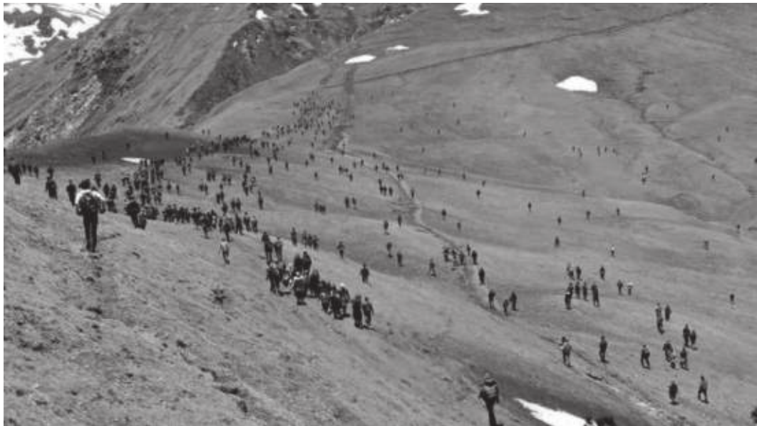
नविन लामिछाने/रासस मनाङ, १ जेठ

स्थानीय तह निर्वाचन-२०७९ अन्तर्गत मनाङमा मतदान र मतगणना कार्य सकिएको छ। जिल्लाको चार स्थानीय तहले नयाँ जनप्रतिनिधि पाइसकेका छन्। तर, मनाङवासीलाई भने स्थानीय तहको निर्वाचनसँगै औषधीजन्य जडिवुटी (यासांगुम्बा) संकलनको चटारो परेको छ। उनीहरू मतदान सकिएपछि यासांगुम्बा संकलन गर्न खर्क पुगेका छन्। स्थानीय तह निर्वाचनमा मतदान गर्न आफ्नो क्षेत्रमा पुगेका मनाङवासी मतदानकार्य सकेर खर्क पुगिसकेका हुन्। उनीहरू आजदेखिने यासांगुम्बा संकलनमा आफुलाई व्यस्त बनाएका छन्। मतदान सकिएको भोलिपल्टै मनाङवासी खर्कतर्फ लागेका हुन्। उनीहरूको मुख्य आयस्रोत जङ्गली औषधीजन्य जडिवुटी यासांगुम्बा नै हो। उनीहरू जडिवुटी संकलनका लागि नारफु, नाम्के खर्क, खाइसार खर्क अहिले पुगिसकेका हुन्। स्थानीय तह निर्वाचनका लागि यासां