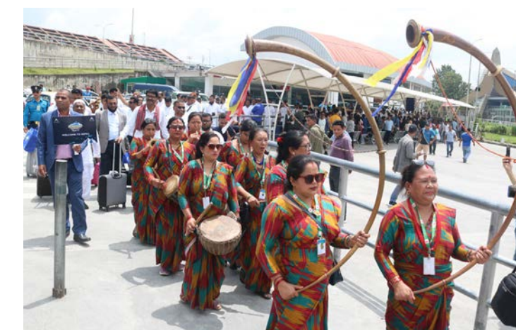
बंगलादेशबाट पहिलो पटक चार्टर्ड जहाजमा नेपाल भ्रमणमा आएका पर्यटकलाई शुक्रबार त्रिभुवन अन्तर्राष्ट्रिय विमानस्थलमा नेपाल पर्यटन बोर्डको तर्फबाट स्वागतका क्रममा।

एउटै कम्पनीमार्फत ठूलो समूहमा बंगलादेशी पर्यटक भित्रिन लागेको यो पहिलो पटक हो। यसले नेपालको पर्यटन प्रवर्द्धनमा महत्वपूर्ण सहयोग पुग्ने बताइएको छ।