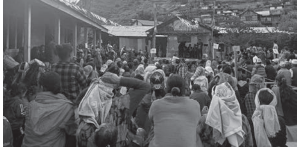
ओवराज शाही/मध्याह्न हुम्ला, १ भदौ

भने १७ लाख १ हजार ८ सय ९६ रुपैयाँ बैक मौज्जा रहेको प्रश शाहीले बताए।