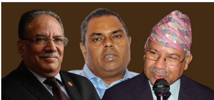
देशव्यापी संगठन निर्माण गरेर चुनावमा गएको भए ९ लाखको सङ्घ २०

नेपाली कांग्रेसले गठबन्धनका अन्य दललाई अपमान गरेको भन्दै सत्तागठबन्धनका केही नेताहरू आक्रोशित देखिन थालेका छन् । गत स्थानीय चुनावमा पद बाँडफाँड देखि सरकारी नियुक्तिमा समेत विभेद गरेको भन्दै आक्रोशित बनेका हुन् । नेकपा एकीकृत समाजवादीका सम्मानित नेता फलनाथ खनालले कांग्रेसले गठबन्धनमा ठूलो अपमान गरेको भन्दै आपत्ति जनाउँदै आएका छन् ।