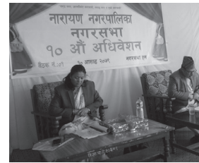
ल्याइएको भन्दै समृद्ध नगरपालिका र सुखी नगरवासी बनाउन प्रतिवद्ध रहेको बताइन्।

उनले विकास निर्माणमा हातेमालो गर्ने खालका कार्यक्रम