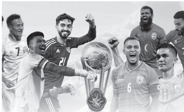
मध्यान्ह संवाददाता काठमाडौं, ३ जेठ

भारतमा आयोजना हुने १४औँ संस्करणको पुरुष साफ च्याम्पियनसिप फुटबलको समूह विभाजन सार्वजनिक भएको छ। दक्षिण एसियाली फुटबल महासंघ (साफ)ले बुधवार च्याम्पियनसिपको समूह विभाजन सार्वजनिक गरेको हो।