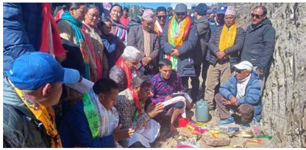
ओवराज शाही/मध्याह्न हुम्ना ४, चैत

हुम्ना सदरमुकाम सिमकोटमा हक्की खेल मैदान निर्माण गरिने भएको छ।