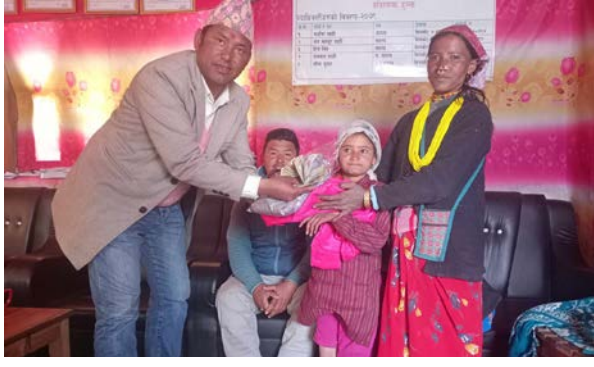
हुम्ना, ४ चैत