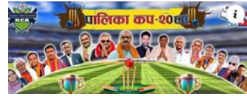
पराजित गर्दै दोस्रो चरणमा सजिलै प्रवेश गर्न सफल भएका हुन्। दुर्गा भगवतीका लागि पहिलो विकेटका

कपमा देवाही गोनाहीले टस जितेर पहिलो ब्याटिङ गर्ने निर्णय गलत साबित भयो। दुर्गा भगवतीको घातक बलिङ सामू १६.५ ओभरमा सबै विकेट गुमाइ ६९ रन बनाएर जितको लागि ७० रनको चुनौती दुर्गा भगवती समक्ष दिए। प्रतिउत्तरमा दुर्गा भगवतीको टिमले ११.४ ओभरमा ३ विकेटको क्षतिमा ७२ रन बनाएर ७ विकेटबाट देवाही गोनाहीलाई