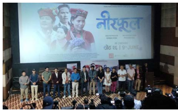
मध्यान्ह संवाददाता काठमाडौं, १२ जेठ

नेपाली कथानक चलचित्र 'नीरफूल' यही जेठ २६ गतेदेखि रिलिज हुने भएको छ। कोरोना महामारीका कारण तीन वर्षअघि प्रदर्शन स्थगित गरिएको चलचित्र 'नीरफूल' रिलिजका लागि अन्तिम तयारीमा रहेको निर्माता टिमले शुक्रवार पत्रकार सम्मेलनमाफर्त जानकारी दिएको हो।