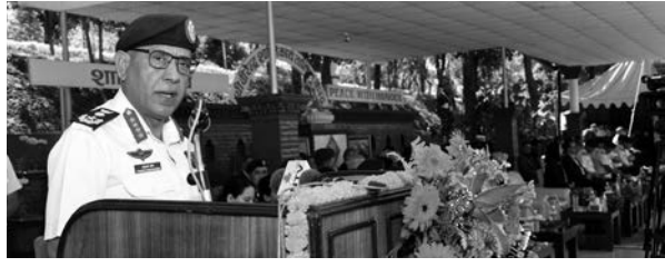
मध्याह्न संवाददाता काठमाडौं, १२ जेठ

प्रधानसेनापति प्रभुराम शर्माले नेपाली सेनालाई शान्ति मिसनका लागि हतियार खरिद गर्नुपर्ने आवश्यकता नै नरहेको बताएका छन्। अन्तर्राष्ट्रिय संयुक्त राष्ट्रसंघीय शान्ति सैनिक दिवसका अवसरमा शुक्रबार आयोजित कार्यक्रममा पत्रकारसँग कुराकानी गर्दै उनले संगठनलाई चाहिने आवश्यक हतियार पर्याप्त मौज्जात रहेकाले अहिले हतियार खरिद गर्नुपर्ने आवश्यकता नै नरहेको स्पष्ट पारे।