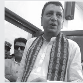
यस्तै पत्रकारले सोधेको