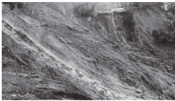
सय बटाला मध्यान्ह रुकुम पश्चिम, २२ साउन