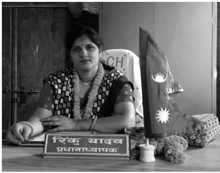
बढी हुँदोरहेछ । विद्यार्थीको त्रिकोणात्मक सम्बन्धमा फलत विद्यालयलाई शिक्षक, अभिभावक र शिक्षण सिकाई प्रभावकारी बनाउने उनले

विद्यालयको शैक्षिक वातावरण, सिकाइ उपलब्धी, व्यवस्थापन, छात्रछात्रा र अभिभावकसंगको समन्वयले विद्यालयलाई नमुना बनाउन सफल भएको उनले बताइन् । उनले भनिन्, 'प्रधानाध्यापक भएपछि जिम्मेवारी, कर्तव्य र उत्तरदायित्व