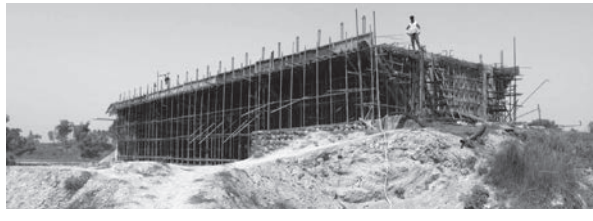
रेशम अधिकारी / मध्याह्न रूपन्देही, २२ जेठ

काम पूरा हुन सकेको छैन। पुल ढलान भएको र यो वर्षमा गाडी चल्ने बताउँदै उनले बाटो भने बनाउनु पर्ने बताए। लम्साले सार्वजनिक खर्च एनको विभिन्न ऐन आउंदा ठेकेदारलाई कारवाही गर्ने नभिकालेको असरसम्म काम नसकेको कालो सूचीमा राख्ने कजरार नदीमाथि निर्माण शुरु गरिएको पुल आठ वर्ष हुँदा पनि निर्माण सम्पन्न भएको हो।