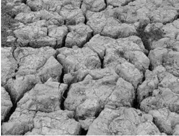
तीन तहको सरकार रहेपनि किसानको पक्षमा काम नगरेको बताए ।