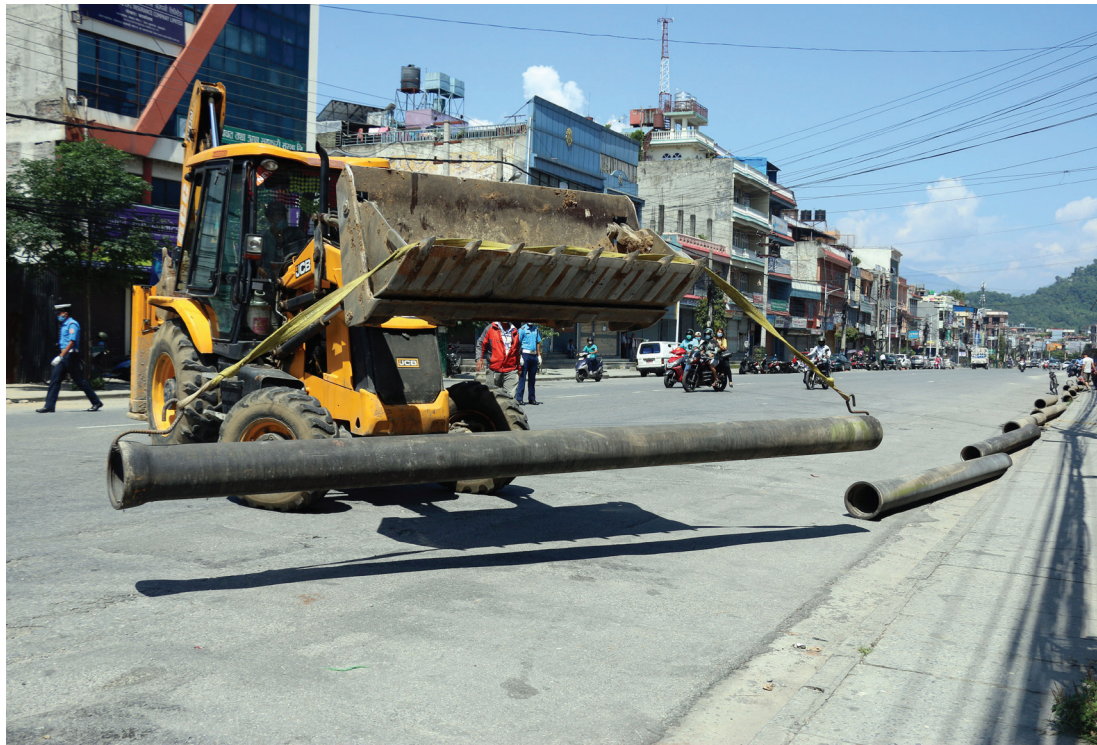
पोखरा महानगरपालिका-८ पृथ्वीचोकमा खानेपानी पाइप भाँडो । बन्दाबन्दीमा पनि विकासका काम धमाधम भइरहेको छ ।

लगातारको लकडाउनले महामारी रोकथाममा सहयोग पुगे पनि जनजीवन नराम्रो गरी प्रभावित बनेको सरकारी मूल्याङ्कन छ । सरकारले कोरोना रोकथाम गर्न गएको चैत ११ गते देखि देशब्यापी लकडाउन गर्दै आएको छ । लामो समय गरिएको लकडाउनबारे निर्णय फेरि दवाव बढ्दै गएको छ । "अहिलेको असहज अवस्था