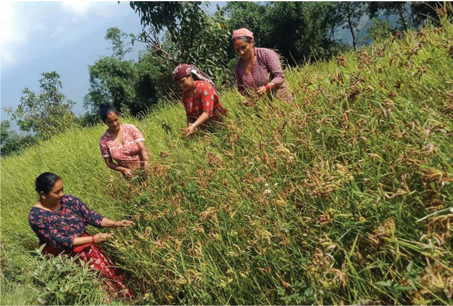
नयाँदीको पुलाचौरका किसान बारीमा कोदो टिप्ने । कोदो बाली मित्रयाउन किसानलाई अहिले चढाउने छ ।