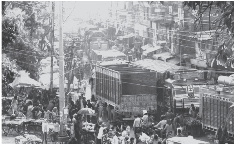
खरिद गर्ने नेपाली उपभोक्ताहरूको घुइँचो लागेको हो।

बडा दशैंकै बेला सुनसरीको धरान, इटहरी, इनरुवा जस्ता विकशित शहरहरूमा खाद्यान्न, लता कपडा र उपभोग्य सामग्रीहरूको मूल्य दोब्बर बढेपछि अहिले सस्तो सामानको खोजीमा भारतको जोगवनीसम्म पुगेर