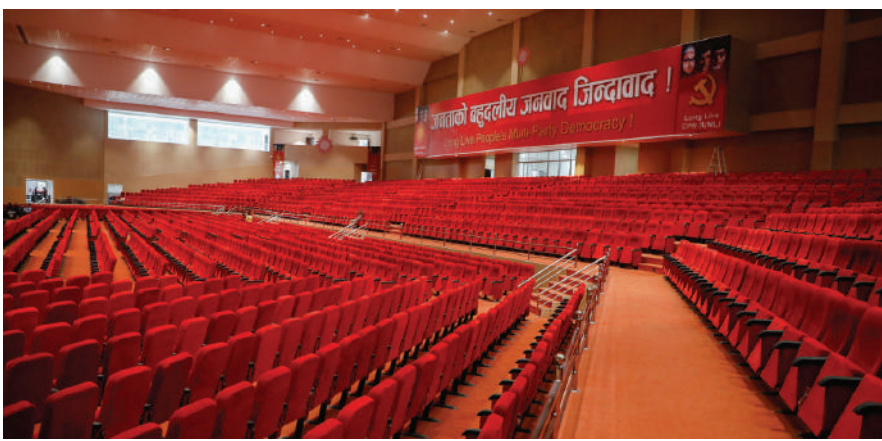
ललितपुरको गोदावरीमा हुने विधान महाधिवेशन हल ।

■ रामबहादुर थापा बादल, नेता, नेकपा एमाले