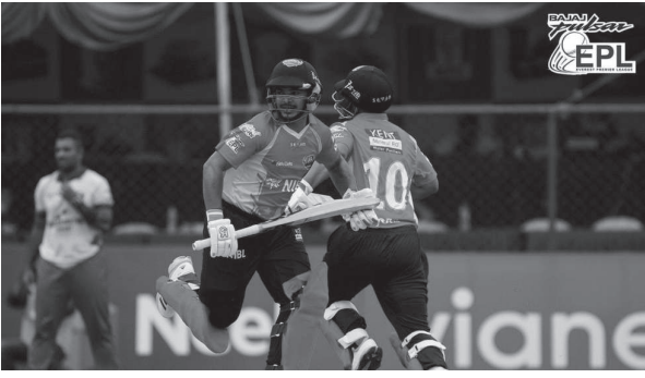
मध्यान्ह संवाददाता काठमाडौं, १४ असोज

एभरेस्ट प्रिमियर लिग (ईपीएल) क्रिकेट अन्तर्गत विहीवार भएको ललितपुर प्याट्रियट्स र भैरहवा ग्लाइडर्सबीचको खेल रोमाञ्चक बराबरीमा रोकिएको छ।