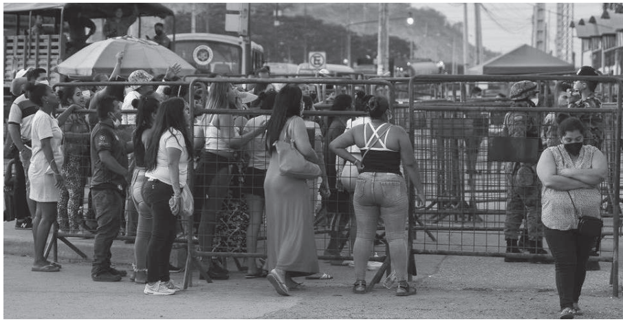
गिरोह हाल इक्वेडरमा सक्य रहेको बताइएको छ।

उक्त जेलमा विश्वव्यापी सञ्जाल रहेको एउटा लागू औषध गिरोहका सदस्यहरूलाई राखिएको थियो। स्थानीय सञ्चारमाध्यमहरूका अनुसार कारागारभित्र त्यस्तो गराउनका लागि शक्तिशाली मेक्सिकन लागूऔषध तस्करीहरूको गिरोहले नियन्त्रण गरेको थियो। उक्त