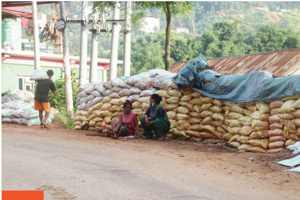
रातोमाटोको व्यापार ! पाँचथरको फिदिम नगरपालिका-४, चारखुम्बेमा रातोमाटो बिक्रीका लागि ग्राहकको प्रतीक्षामा बसेका महिला । लेची राजमार्ग छेउमा राखिएको माटो पाँचथर, ताप्लेजुङ, तेह्रथुम गाउँका नागरिक खरिद गरी घर लियपोतका लागि लैजाउने गर्छन् ।