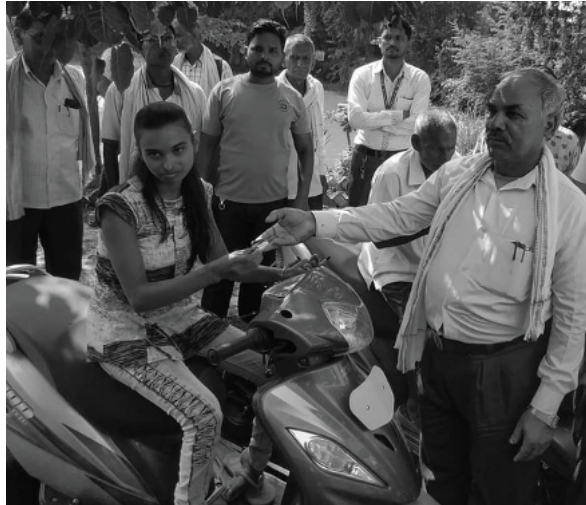
इमरान खान/मध्याह्न कपिलवस्तु, २० भदौ

अपाङ्गता भएका स्थानीयहरूको दैनिक जीवनमा सहजता ल्याउन कपिलवस्तुको शुद्धोद्यम गाउँपालिकाले अपाङ्गता भएका १० जनालाई चार पांग्रे स्कुटी प्रदान गरेको छ। अपाङ्गताका कारण हिँडडुल गर्न नसक्दा कष्टकर जीवन बिताइरहेका उनीहरूलाई सो स्कुटी प्रदान गरिएको हो।