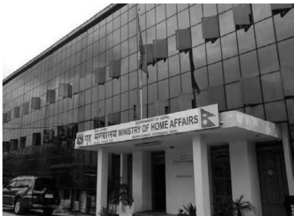
वनाउन चाहने र नेपाली भूमिमा कुनै पनि राष्ट्र विरुद्धका गतिविधि हुन नदिने विषयमा कटिबद्ध रहेको

काठमाडौं/मस- भारतीय प्रधानमन्त्री विरुद्धको प्रदर्शनप्रति गृह मन्त्रालयले आपत्ति जनाएको छ। गृह मन्त्रालयले एक विज्ञप्ति जारी गरी नेपालका मित्रराष्ट्रका विषयमा अनावश्यक टिप्पणी गरेर उनीहरूको स्वाभिमानमा प्रश्न नउठाउन आग्रह गरेको छ।