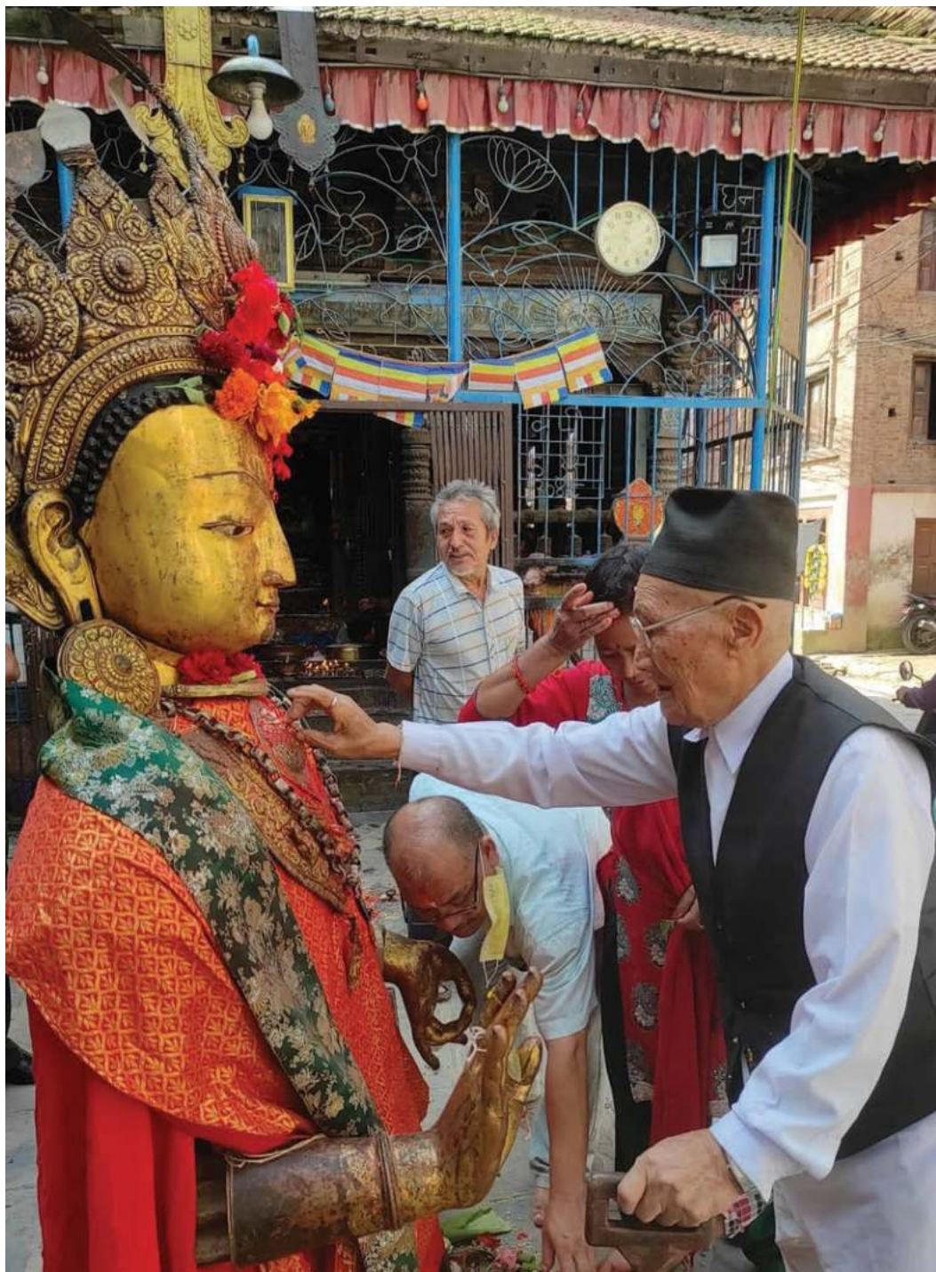
भक्तपुरको मध्यपुरथिमि मठटोलस्थित हिरण्यवर्ण महाविहारमा फचदानका लागि प्रदर्शनीमा राखिएको दीपशंकर पूजा गरिँदै ।