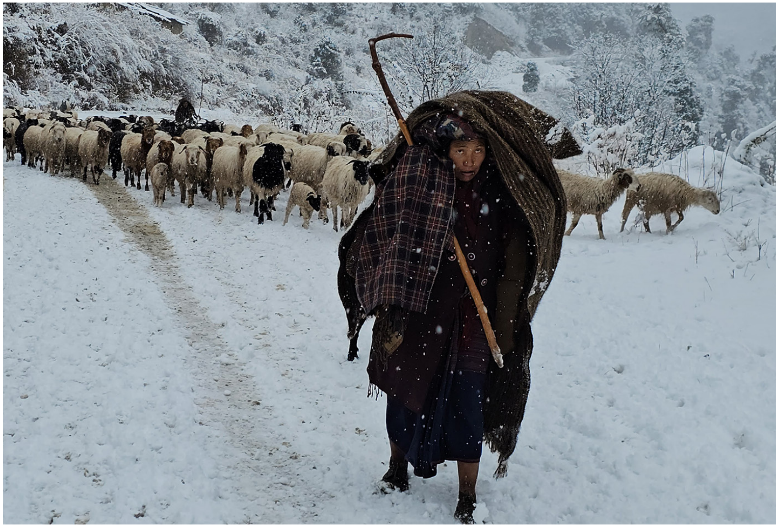
रुकुम पूर्वको ठुलो गाउँपालिका-१ स्थित पहाडी भेगाबाट गाउँ नजिक भेडीगोठ सादै रुकुम पूर्व रुकुमका स्थानीय भेडा पालक किसान ।