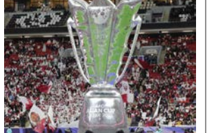
विश्व शर्मा पौडेल/मध्यान्ह दोहा, कतार, १८ माघ

कतारमा जारी एसियन कपको क्वाटरफाइनल समीकरण पूरा भएको छ । बुधवार सम्पन्न दुई अलग अलग खेलमा इरानले सिरियामाथि टाइब्रेकरमा ५-३ र बहाराइनमाथि जापान ३-१ ले विजयी भएसँगै क्वाटरफाइनल समीकरण पूरा भएको हो । शुक्रवारबाट क्वाटरफाइनलका खेल शुरु हुँदैछन् । शुक्रवार क्वाटरफाइनलमा ताजिकिस्तानले जोर्डनसँग र अस्ट्रेलियाले दक्षिण कोरियाको सामना गर्नेछन् । तीन पटकको कप विजेता इरानले चार पटक विजेता बनेको जापानविरुद्ध र कतारले उज्वेलिस्तानविरुद्ध शनिवार खेल्नेछन् । बुधवार दोहास्थित अल-थुमामा स्टेडियममा भएको खेलमा जापान ३-१ ले विजयी भएको हो । खेलको ३१औं मिनेटमा रिस्सु दोआनले रिवाउण्डमा गोल गर्दै जापानलाई शुरुवाती अग्रता दिलाएका थिए । ४९औं मिनेटमा ताकेफुसा कुबोले गोल गर्दै अग्रता दोब्बर बनाए । खेलको ६४औं मिनेटमा बहाराइनले एक गोल फर्काउनु सफल भयो । जापान गोलरक्षक जायन सुजुकीले बचाउ गरेपछि दोस्रो पटकमा आफ्नै डिफेन्डरसँग सम्पर्क नमिलेपछि उनले समाल खोजेको बल आफ्नै जालमा हालेका थिए । तर ७२औं मिनेटमा आयासे युएडाले गोल गर्दै दुई गोलको अन्तर कायम गर्दै जित सुनिश्चित गरे । बुधवार राति सम्पन्न अर्को अन्तिम फ्रिक्वाटरफाइनलमा इरानले सिरियामाथि टाइब्रेकरमा ५-३ को जित निकालेको हो । निर्धारित ९० मिनेटको खेल १-१ को र अतिरिक्त समयमा पनि सोही स्कोर रहेपछि खेल टाइब्रेकरमा गएको थियो । टाइब्रेकरमा सिरियाका फहाद युसेफको पेनाल्टी इरान गोलरक्षक अलिरेजाले बचाएका थिए । ३४औं मिनेटमा मेहदी तरेमीले पेनाल्टीमा गोल गर्दै इरानलाई अग्रता दिलाएका थिए । सिरियाका ओमार खिबिनले ६४औं मिनेटमा पेनाल्टीमा नै गोल गर्दै खेल बराबरीमा ल्याएका थिए ।