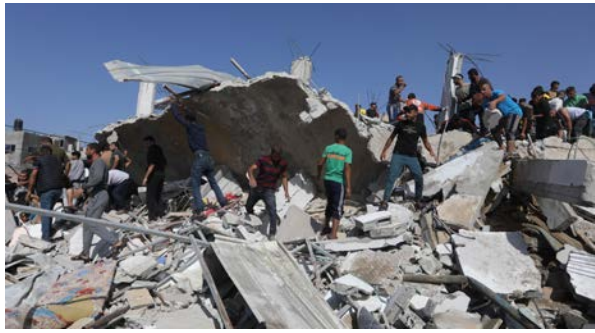
असन्तुष्टि व्यक्त गरे। गुटेरेसले नागरिक पूर्वाधारमा गम्भीर असर परेको औल्याउँदै गाजामा घर, अस्पताल, विद्यालय, पानी र सरसफाइ सुविधाहरूसहित ७० प्रतिशतभन्दा बढी संरचना नष्ट भएको बताए। अन्तर्राष्ट्रिय मानवीय कानूनको सिद्धान्तलाई पुनःपुष्टि गर्दै उनले द्वन्द्वको कुनै पनि पक्ष अन्तर्राष्ट्रिय कानूनभन्दा माथि नहुने कुरामा जोड दिए।

काठमाडौं/एजेन्सी- संयुक्त राष्ट्रसंघका महासचिव एन्टोनियो गुटेरेसले बुधवार गाजालगायत छिमेकी क्षेत्रमा तनाव कम गर्न तत्काल कदम चाल्न आग्रह गरेका छन्। असहज परिस्थितिमा समयमै नियन्त्रण गरी यस क्षेत्रलाई थप हिंसाबाट बचाउन तत्काल कदम चाल्न महासचिव गुटेरेसले आह्वान गरेका हुन्। संयुक्त राष्ट्रसंघका शीर्ष अधिकारीले प्यालेस्टिनी जनताको अपरिहार्य अधिकारको अभ्याससम्बन्धि समितिको बैठकसमेतमा यो विषयको उठान गरेका थिए।