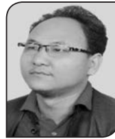
● निष्पु थिङ